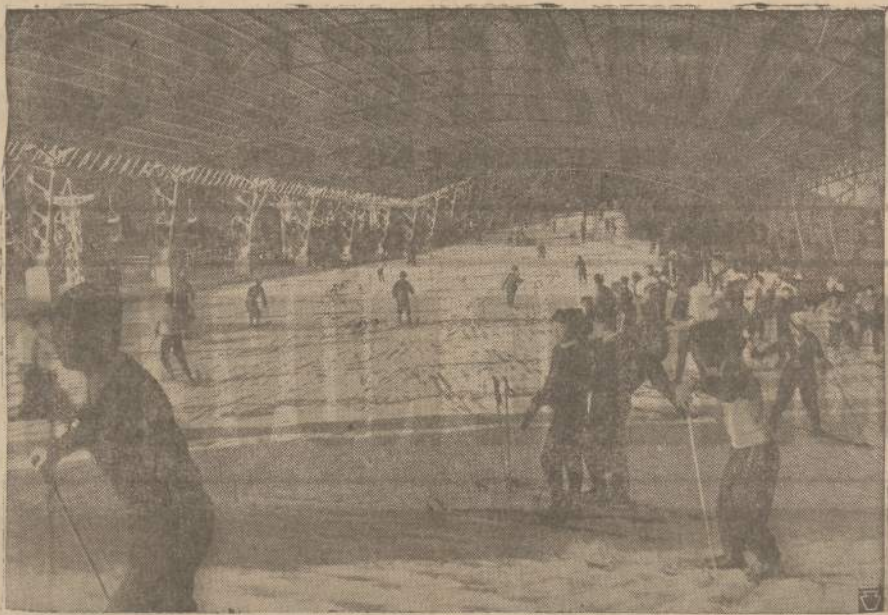
Stidinėjimo sportas Japonijoje pasidarė nepaprastai populiarus. Priskaitoma apie 3 mil. stidinėjų.

Man buvo labai malonu pažinti vieną turiausių mūsų tautos atstovų. Pradžioje mane stūmė paprastas žingeidumas, kartais atmieštas abejoniškas, o vėliau, kai susitkau su žmogumi, tai gailėjai, kad mano laikas buvo toks trumpas, kad negalėjau dar bent poros dienų praleisti Majungoje. Kiek sužinojau apie Madagaskarą, kiek patyriau apie