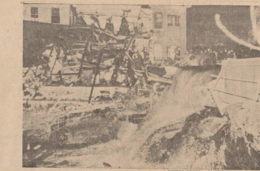
Vanduo pakilo 20 pėdų ir užliejo keturias ketvirtinaiškas mylias Norwich (Conn.) mieste.

Dalyvis, turbūt, nežino, kad ir į šią šventę svečius kviečiant vietiniai lietuviai demokratų gerokai derybas turėjo vesti, kol Alto skyr. pirmininkas sutiko į