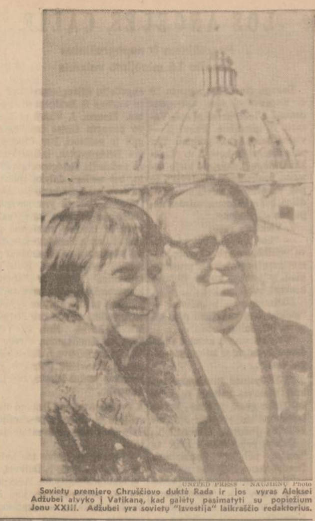
Sovietų premiero Chrusčiovos dukterė Rada ir jos vyras Aleksej Adžubei atvyko į Vatikaną, kad galėtų pasimatyti su popiežium Jonu XXIII. Adžubei yra sovietų "Izvestija" laikraščio redaktorius.

Visų pirma iš lentelės matome, kaip sistematiškai ir be svyravimų augo nurodytų dvių kooperatyvų organizacijų prekybos apyvartos. Tiesa, 1932 m. suma mažesnė už 1930 m. sumą, o 1934 m. dar mažesnė. Bet tai nereikia apyvartų sumažėjimo: minimais metais labai kritę visų prekių kainos; kiekviškai apyvartos padidėjo, bet kritus kainoms, visų jų vertė buvo mažesnė. Dirbant laisvos konkurencijos sąlygose per 11 metų kooperatyvams padidinti