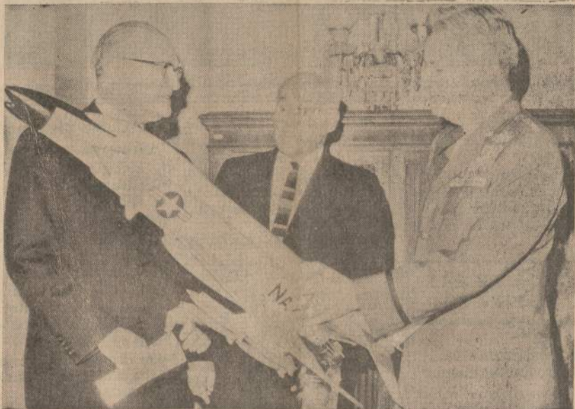
Oro jėgų sekretorius Eugene M. Zuckert (viduryje) Senato ginkluotos tarnybos komitetui pareiškė, jog Amerikos oro jėgos yra geriau paruoštos, negu kada nors taikos laiku. Dešinėje yra generalas Curtis LeMay, oro jėgų štabo viršininkas, o kairėje — komiteto pirmininkas sen. John Stennis.

Tarp didžiųjų Vakarų pasaulio valstybininkų matome nemažą katalikų — prezidentus Kennedy, De Gaulle, kanclerį Adenauerį. Sveikindamas popiežium taikos, nusiginklavimo, atominių bombų bandymų uždraudimo pastangas, Nikita Chruščevas nuduoda nustebes, kaip tokie dideli katalikai nerodo tokio entuziazmo popiežiaus taikos siekiam, kokį rodo bedieviai komunistai.