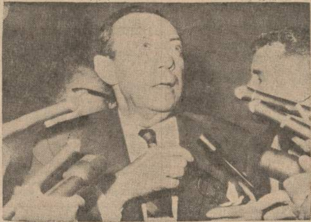
New Yorko mēras Robert Wagner praneša, jog New Yorko laikraščiai susitarė su uniija ir streikas, kuris tęsiasi 92 dienas, baigtas. Laikraščiai gal šios savaitės gale pradės išeiti.

LIETUVIŲ KOMPANIJA WORLD PARCEL SERVICE 3320 SO. HALSTED ST. — CHICAGO 8, ILL. Tel.: YA 7-0677