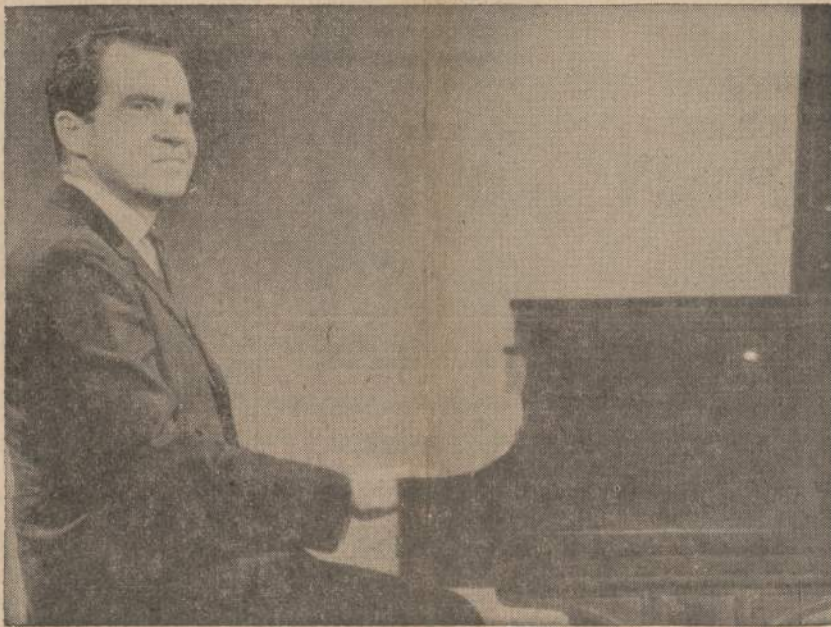
Skambindamas pianinu, buvęs viceprezidentas Nixonas televizijos programoje palietė įvairius politinius klausimus, juokais pastebėdamas, jog jo politinė karjera baigta, nes respublikonai tikrai nenorės Baltuosiuose Rūmuose turėti kito pianisto (pianu skambindavo buvęs prezidentas Trumanas).

— Kai sodybiniai sklypai perleidžiami į bendrą aruodą. Vasario 22 d. iš Vilniaus radijo atsakymų į klausytojų laiškus paaiškėjo: jei kuris kolchozininkų turėjęs kiek didesnį sklypą, negu nustatyta, tai tokiame sklype išauginti rugiai kolchozo valdybos sulikviduojami ir paimami į bendrą kolchozo aruodą. (E)