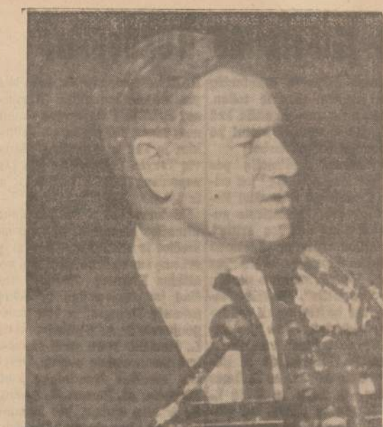
Milwaukee (Wis.) respublikonai surengė respublikonų partijos rinkimus... prezidento Kennedy mokėsiy sumazinimo plano kritikai.

Pakilusių jausmų valandose, kai 1955 m. buvo sprendžiamas rusų atitraukimas ir prieš akis išliko nepriklausomybės grįžimas, Viena be jokių rezervų sutiko tą rusų reikalavimą priimti. Tačiau laiko bėgyje šitas krašte likusių raudonarmiečių