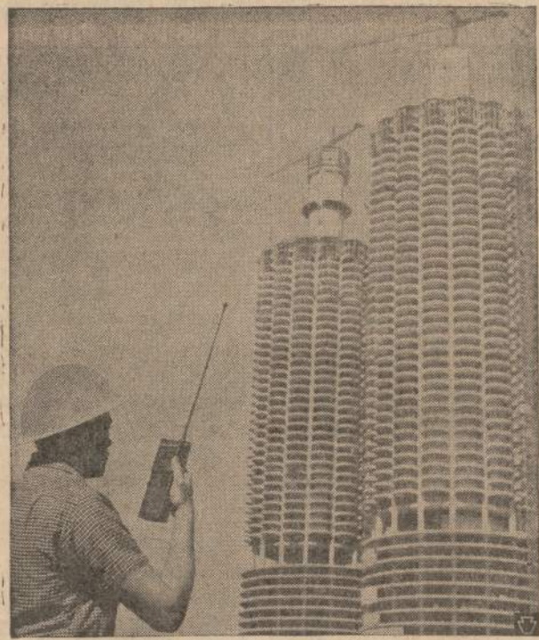
Motorola kompanija pagamino mažytį radio siustuvą, kuris sveria tik 33 sv. Tos rūšies siustuvus yra naudingas vykdati didelių pastatų statyba. Juo taip pat gali naudotis policija, gaisrininkai, įvairios valdžios agentūros, naftos kompanijos ir t. t.

SKAITYTI PATS IR PARAGINK KITOS SKAITYTI NAUJIENAS JOS VISAD RAŠO TEISYBĘ