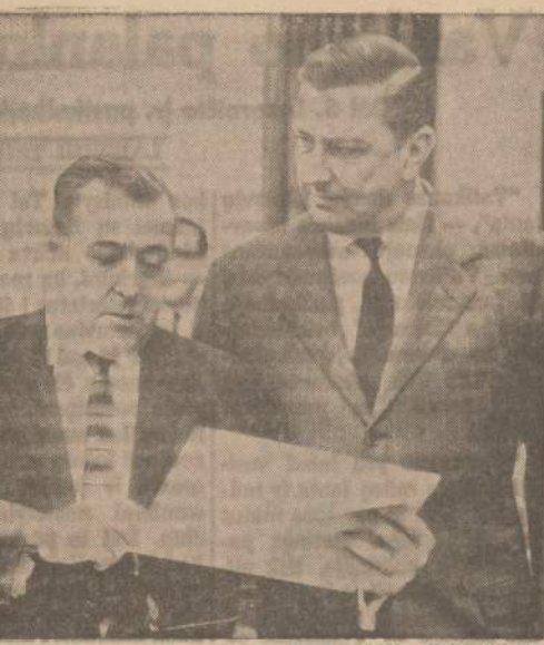
Franklin D. Roosevelt, Jr. (dešinėje), kurį prezidentas Kennedy nominavo prekybos psekretoriaus postui.

Vienas turtingas amerikietis pamiršo paslapti, kaip atidaryti savo seifą. Kvietė visokius šaltkalvius ir specialistus, niekas negalėjo atidaryti. Pašaukė kalėjimo viršininką, kuris netrukus atvyko su kalėjime sėdinčių spintų išlaužimo specialistu plėšiku. Tas tik pačiupinėjo, ausį