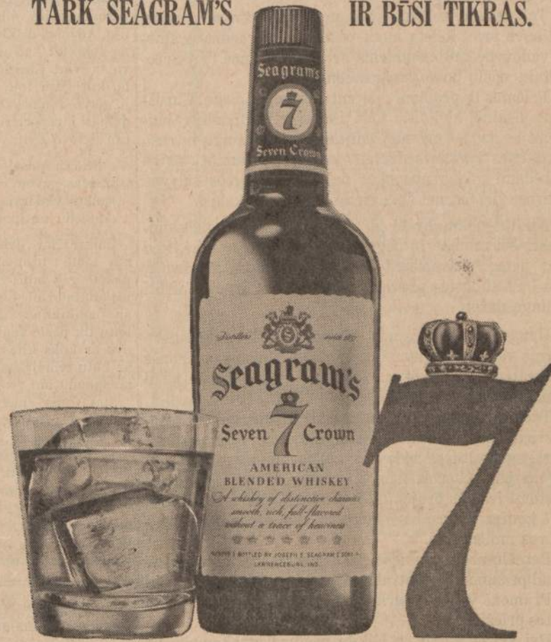
SEAGRAM-DISTILLERS COMPANY, NEW YORK CITY. BLENDED WHISKEY, 66 PROOF, 65% GRAIN NEUTRAL SPIRITS

JI LABIAU PATINKA DIDESNIAM ŽMONIŲ SKAIČIUI ĮVAIRIAUSIOS RŪŠIES GERIMUOSE, NEGU BET KURI KITA IKI ŠIO METO PAGAMINTA DEGTINĖ. TAI STAMBUS TVIRTINIMAS? TAI BENT DEGTINĖ! NEPATIKĖK VIEN MŪSŲ TVIRTINIMU. BET GALI PATIKĖTI MŪSŲ SKONIU. TARK SEAGRAM'S IR BŪSI TIKRAS.