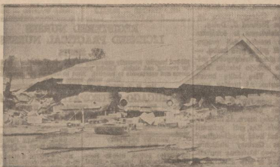
Dėl tornado, nusiurbusio Mississippi, Alabamos ir Tennessee valstybės, kiek jau žinoma, žuvo keturi žmonės, o sužeisti skaičius yra kelis kartus didesnis. Nuotraukoje matomi Cedar Grove (Tenn.) tornado sugriautas garažas.

In Eastern Europe, eighty million people live under the iron rule of Communism. Radio Free Europe's daily broadcasts bring them hope, news, keep up their resistance to Communist brainwashing. Help overrule Communism with truth, by supporting Radio Free Europe. Send your contributions to Radio Free Europe Fund P.O. Box 1983, Mt. Vernon, N.Y. Published as a public service in cooperation with The Advertising Council