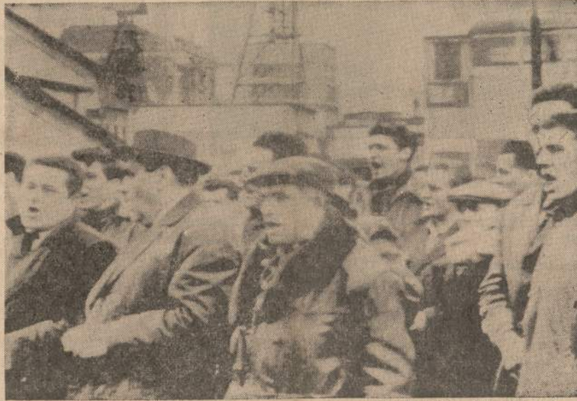
Merlebach (Prancūzijoje) streikuojantys angliakasiai šūkauja, reikalaudami, kad baltakalnieriai kasyklų darbininkai mestų darbą.