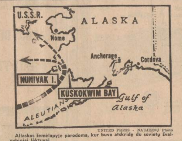
Aliaskos žemėlapyje parodoma, kur buvo atskridę du sovietų žvalgybiniai lėktuvai.

1962 m. savo gyvenamas vietas pakeitė vienas milijonas lenkų. Iš 7,766,000 dirbančiųjų, 1961 m. dėl ligos praleido 88,700,000 darbo dienų. 1962 m. per 10 mėn. Lenkijos gyventojai įsigijo 261,000 televizijos aparatų 77,000 daugiau, kaip tuo pačiu laikotarpiu 1961 m. (E)