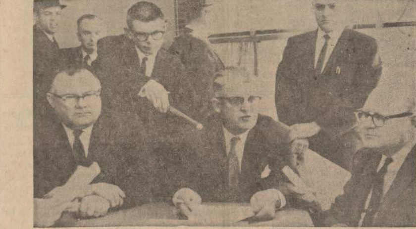
Southern Pacific geležinkelio kompanijos vadovyvė ir Geležinkelio tarnautojų brolija susitarė ir pasirašė sutartį penkeriems metams ryšium su vykdymu automatizacijos.

Išvažiavo sėti bulvių Sekmadienį išplaukė pirmoji saliečių grupė iš 51, aprūpinti sėklinėmis bulvėmis. Kai ateis