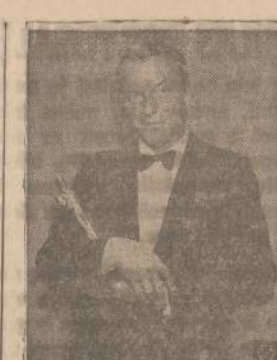
Frank Sinatra, kuris vadovaus balandžio 8 d. vadinamųjų „Oskaru“ įteikimo gėriausiams kino aktoriams ir aktorėms ceremonijoms. Tos ceremonijos bus rodomos televizijoje. Sinatra yra pats pasižymėjęs kino ir televizijos aktorius.

Bedarbė niekuo nepriseda prie tautos ekonomijos ir augimo. Priverstinai bedarbė tarp jaunų žmonių gali prisidėti prie nusikaltimų faktoriaus. O už vis labiausiai — „iškritėliai“ yra žmogiškų sugebėjimų ir talentų niekais leidimas.