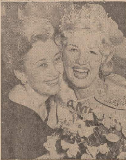
Motina apglėbia ir sveikina savo dukrą Diane Sawyer (dešinėje), kuri Mobile (Alabamoje) laimėjo Amerikos 1963 metų jaunių pamelės titulą. Ji yra Louisville (Ky.) aukštesnės mokyklos mokinė.

Italai tvirtina, kad Kolumbas 1473 metais išplaukė į vakarus darbo ir laimės ieškoti, bet ispanų šaltiniai tvirtina, kad jo gyvenimas kitaip vystėsi. Ispanai tvirtina, kad jis gimęs Katalunijoje, kur dar ir šiandien yra kelios Kolumbų šeimos ir gausūs jų aniniai, kad jis baigė