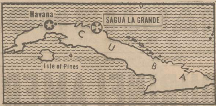
Kubos pabėgėliai apšaudė sovietų prekinį laivą Sagua La Grande uoste, o taip pat buvo užpuolę sovietų karinę stovyklą netoli Havanos. Ega susirėmė keli rusai žuvę. Čia parodomas žemėlapis, kuriame atžymėtos vietos, kur užpuolimai įvyko.

Komandoms išsirikiavus ir vakarų V-jos vėliavai pakilus ant stiebo, rytiečiai pagal "sportinio vadovo" ženklą atsuko vėliavai nugaras, kur keletas iš jų