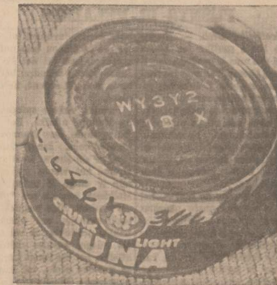
SEIMININKĖS yra išpėjamos nevaruoti Tuna konservų, kurių dėžutės yra atžymėtos fokiais numeriais: WY3Y2 ir žemiai 118X. Maisto krautuves tuos konservus jau yra pašalinusios. O tai dėl to, kad Detroito, kaip manoma, nuo tu konservų mirė dvi moterys. Manoma, jog tuose konservuose yra atsiradę botulininiai nuodai.

Kai kada įbauginimas yra žodinis, o kai kada net jėgos pavartojimas, kartais ir eko-