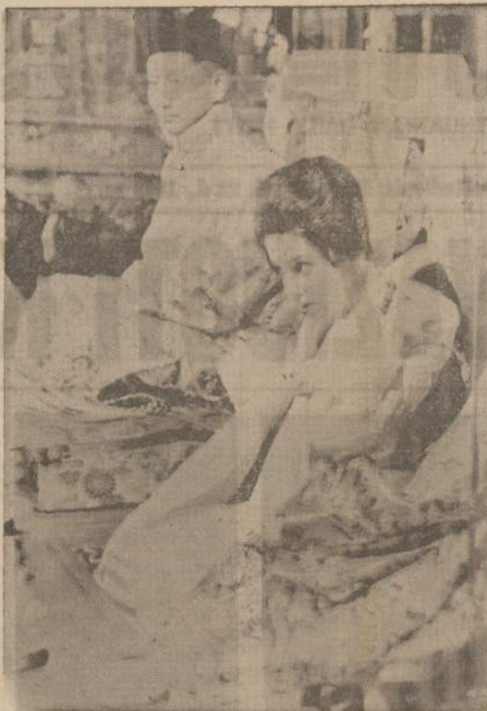
Niujorkietis Hope Cooke ir sosto įpėdinis, princas Palden Thandup Nangyal, sutuoktųjų budistinės ceremonijos Gangtoke, Šikim valstybėje, kuri yra prie Himalajų kalnų. Cooke yra pirmas amerikietis, įsteigęs už Azijos karališkos giminės namus.

Dabar stabtelkim prie kainų. Vidutiniški pietūs miesto centre kainuoja $1.50-$2.00. Mačiau patiekalą "Strasburgo žąsų kepenikės su grūdžiais" — 100 šilingų (4 doleriai). Po to sekė patiekalai už 60, 50 šilingų ir t. t. Bet yra paprastų valgyklų, kur už 25 arba net ir už 20 šilingų iš 3 patiekalų pietus pa-