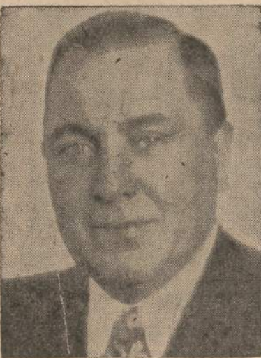
RICHARD J. DALEY, Chicagos mēras

LIETUVIŲ DEMOKRATŲ LYGOS BANKETO RENGIMO KOMITETAS