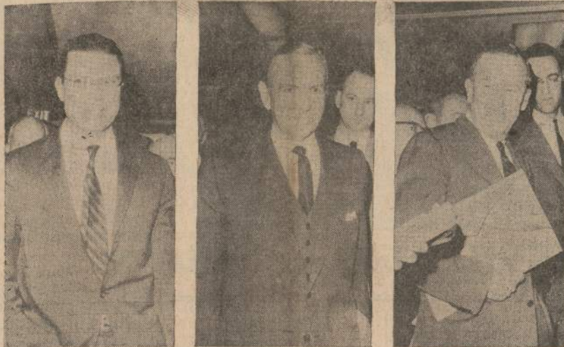
Senato subkomitetas pašaukė gynybos sekretoriaus pavaduotoją, Roswell Gilpatric, kad pasakytų, kas iš karo vadovybės neigiamai atsiliepė apie T-F-X lėktuvą ir senatorių Henry M. Jacksoną, kuris vadovauja tyrinėjimui. Iš kairės į dešinę: gynybos sekretorius Robert S. McNamara; Gilpatric ir senatorius Jackson.