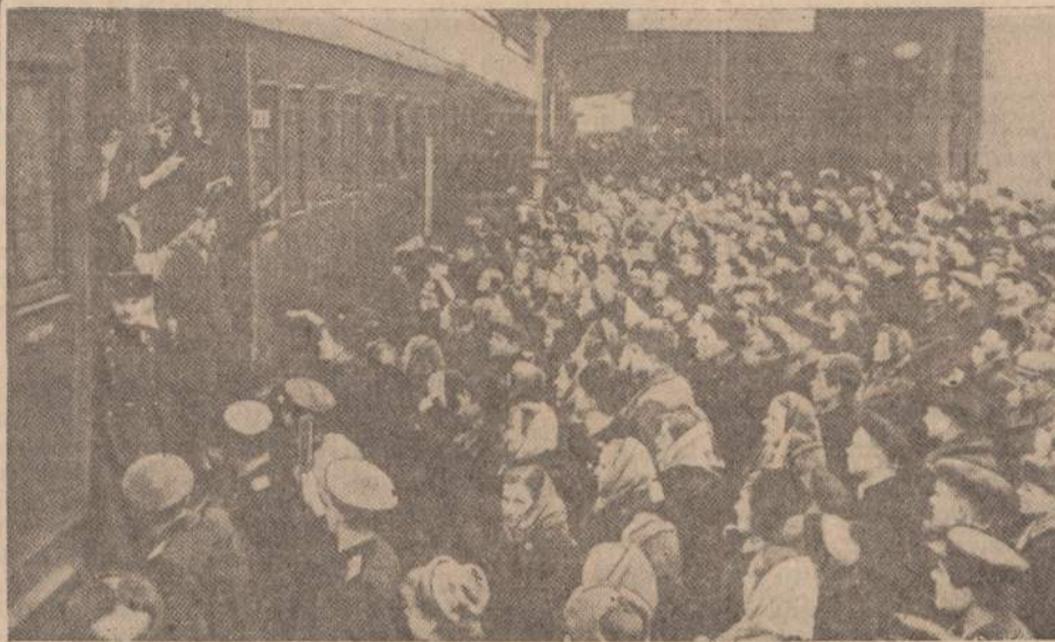
Lietuvių trėnimai Sibiran 1941 m.

Be masinių Lietuvos gyventojų trėnimų, kurie buvo 1941 ir 1944—1951 m. mes nuolat randame žinių, apie Lietuvos ir kitų kraštų jaunimo neva "savanorišką" išvežimą į Sibiro plėšimines žemes vasaros ar ir pastoviems laukų darbams. Kiek iš Lietuvos tokių jaunuolių "savanorių" išvažiavo, niekas jokių duomenų nepaskelbė ir nepaskelbs. Mes tik žinome išvežimų faktus. O iš viso apie gyventojų perkilnojamus sovietinė spauda ligi šiolei visiškai tylėjo. Tik tai 1961 metų Maskvoje leidžiamasis žurnalas "Ekonomika Selschego Choziaistva" nr. 8 duoda straipsnį, kuriuo nagrinėjamas SSSR gyventojų perkeldinėjimas. Straipsnyje rašoma, kad carų valdymo laikais ekonominiais ir politiniais sumetimais "Perkeliamuosius gabendavo į