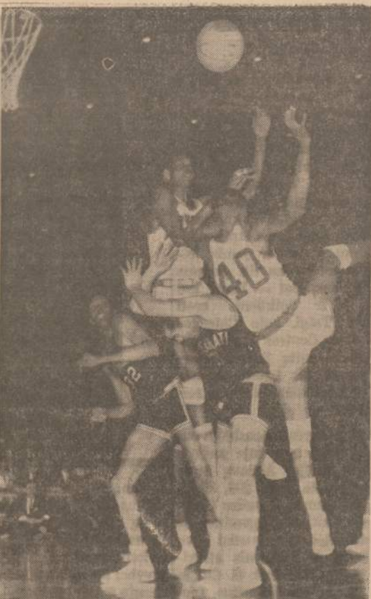
Louisville (Ky.) įvyko Loyolos ir Cincinnati universitetų krepšinio rinktinų rungtynės dėl čempionato. Loyolos (iš Chicago) rinktinė laimėjo santykiu 60 prieš 58.