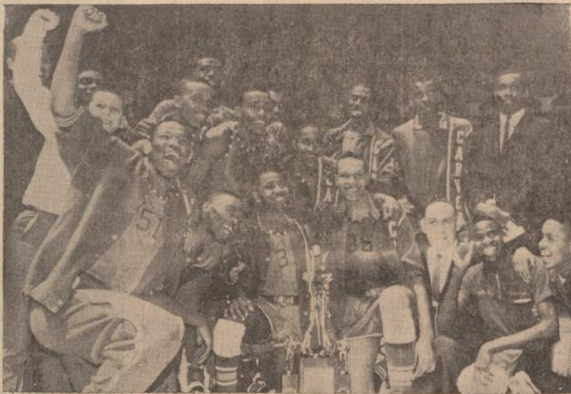
Carver aukštesniosios mokyklos (Chicagoje) krepšinio rinktinė po laimėjimo rungtynių, kurios įvyko Champaign, Ill. Carver rinktinė, nugalėdama Centralia aukštesniosios mokyklos krepšininikus, laimėjo pirmą vietą tarp viešųjų aukšt. mokyklų. Laimėjimo santykis buvo 53 prieš 52.