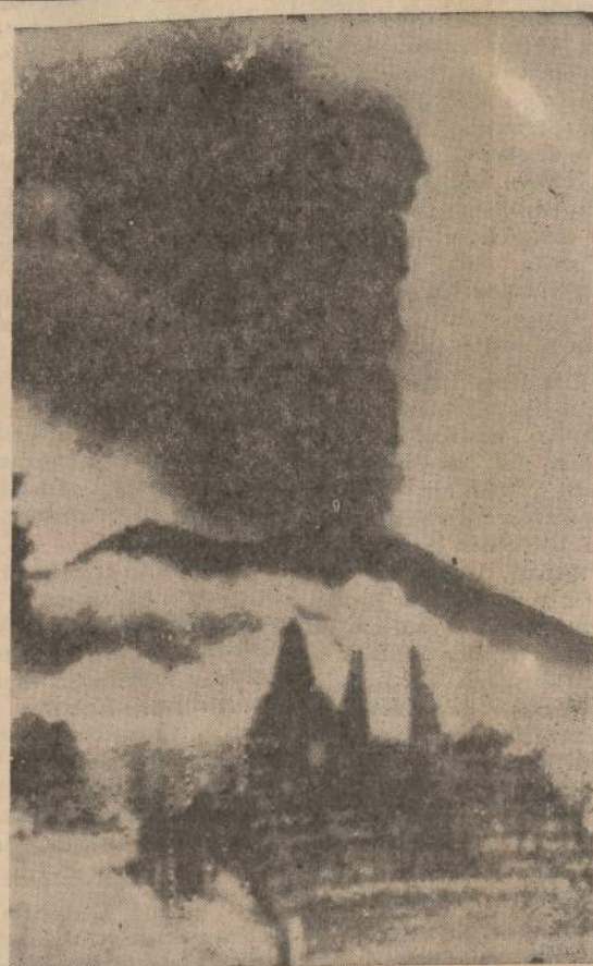
Bali saloje išsiveržė Agung ugniakalnį, sunaikindamas penkis kaimus. Žuvo apie 1,500 žmonių. Čia parodoma Besakih kaimo šventovė, kuri buvo sunaikinta.

Aišku, kad didelė dauguma kongreso narių yra sąžiningi, padorūs. Bet jie nieko nepasakys apie savo kolegų nusikaltimus dėl baimės, dėl kurios aš nedrįsau pasirašyti savo pavardės, išvedžioja anas sąžiningas, bet bailus kongreso narys.