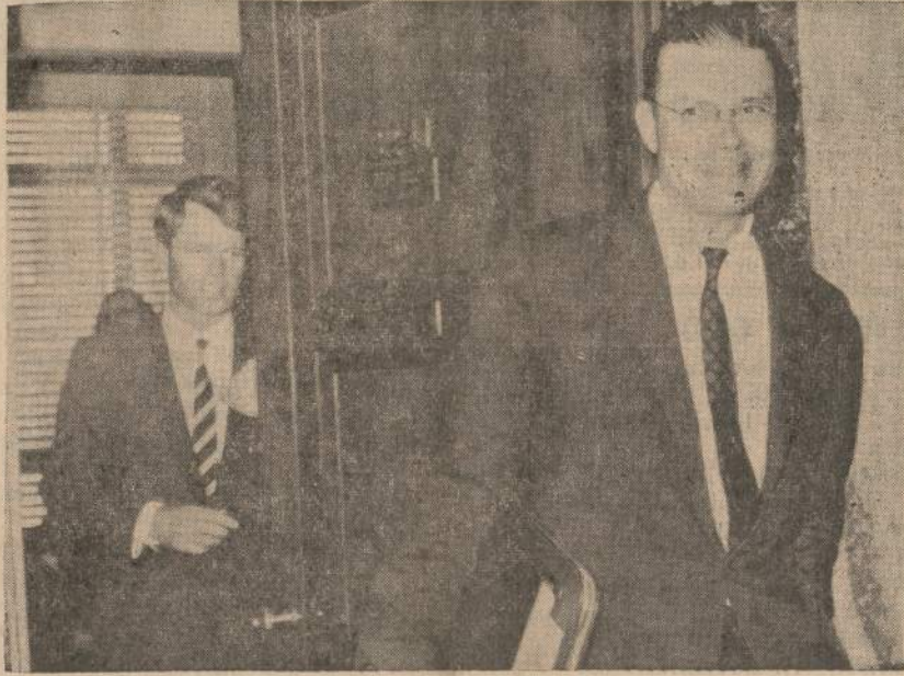
Vyriausias prokuroras Robert Kennedy (kairėje) ir gynybos sekretorius Robert McNamara buvo pas senatorių John McClellan, kurs vadovauja apklausinėjimams dėl ginčytino TFX karinių lėktuvų kontrakto.

Sovietų atsakyme nėra tokių dalykų, kaip prisipažinimo ir atsiprašymo. Jų lėktuvai nebuvo arčiau Aliaskos teritorijos kaip 217 mylių. JAV vyriausybė tvirtino, kad jie buvo įskridę 30 mylių į Aliaską.