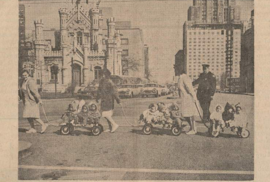
St. Vincent's našlaičių prieglaudos įnamiai sulauko judėjimą labai judrioje Michigan gatvėje, Čikagoje. Tokia procesija pasikartoja beveik kasdien, kai yra gražus oras.