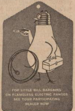
FOR LITTLE BILL BARGAINS ON FLAMELESS ELECTRIC RANGES SEE YOUR PARTICIPATING DEALER NOW

Commonwealth Edison Public Service Company