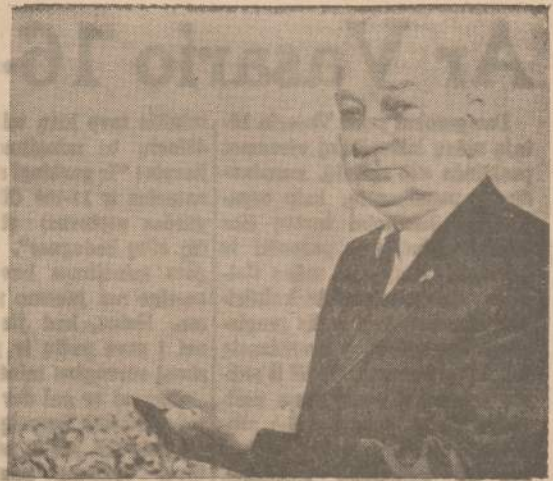
Kongreso respublikonų vadovs Charles A. Halleck laiko laiška, kuri jį gavo iš buvusio prezidento Eisenhowerio. Laiške sakoma, jog valdžios išlaidos turėtų būti sumažintos bent trylikos milijonų dolerių.

"Laikraščiai kasdien praneša apie teismus įvairiose sovietų respublikose, kur baudžiama įvairūs darbo vengiantys elementai, o ypač skaudžiai, net mirties bausme baudžiami vadinami spekuliantai, išnaudotojai ar valstybinio turto pasisavintojai".