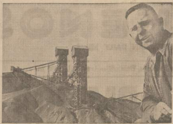
Galena (Ill.) apylinkėje užsidaro turtingos cinko kasyklos, iš kurių per paskutiniuosius 17 metų buvo iškasta 3,500,000 tonų cinko rūdos. Netekusiems darbu siūloma važiuoti į Knoxville (Tenn.) apylinkėje esančias kasyklas.

Scottsdale mieste lietuvių mažai tėra. Jie daugiausia yra susibūrę Phoenix'e, kuris yra visai netoli nuo Scottsdale. Tačiau, kai neturi savo ratų, tai netoli tegali keliauti. O tai reiškia, jog susidaro keblumų, kai nori pažįstamus tautiečius aplankyti. Vis dėlto proga pasitaikė su kai kuriais jų pasimatyti. O tokią