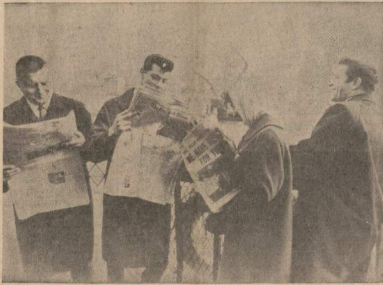
Pagaliau ir New Yorko gyventojai susilaukė laikraščių. 18,000 žmonių, kurie dirba prie laikraščių, vėl grįžo į darbą, nes streikas pasibaigė.