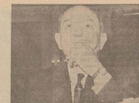
Valstybės sekretorius Dean Rusk Kongreso užsieniui teikimo pagalbos komiteto posėdyje pasakė, jog šaltasis karas pakrypo Amerikos naudai. Rusk prašė nemazinti pagalbos užsieniui.