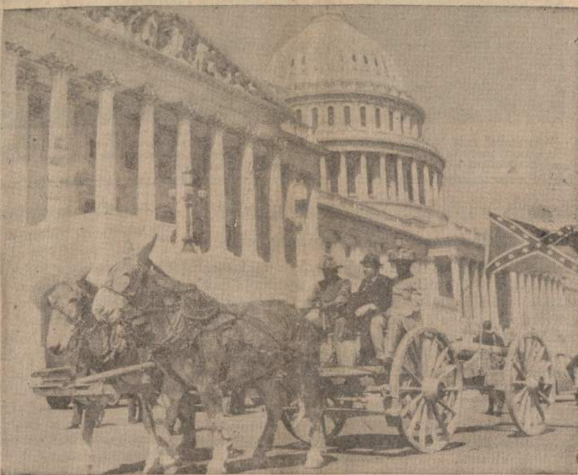
Iš McMinnville (Tenn.) į Washingtoną buvo atgabenta muly traukiama patranka, kuri buvo naudojama pilietinio karo metu. Ji vežama buvo 622 mylias. Patranką atgabeno ryšium su šimto metų pilietinio karo minėjimu.

MONTREALIS. — Aukštųjų išvakarėse Kanados spauda pradėjo rašyti apie prezidento Kennedžio slapta dokumentą, kurį jo patarėjas Walt Rostow pametė 1961 m. gegužės mėn., kai prezidentas buvo atvažiavęs į Kanadą pademonstruoti „draugystę ir vienybę“. Slaptame dokumente, kuris vėliau buvo rastas esą užrašyta