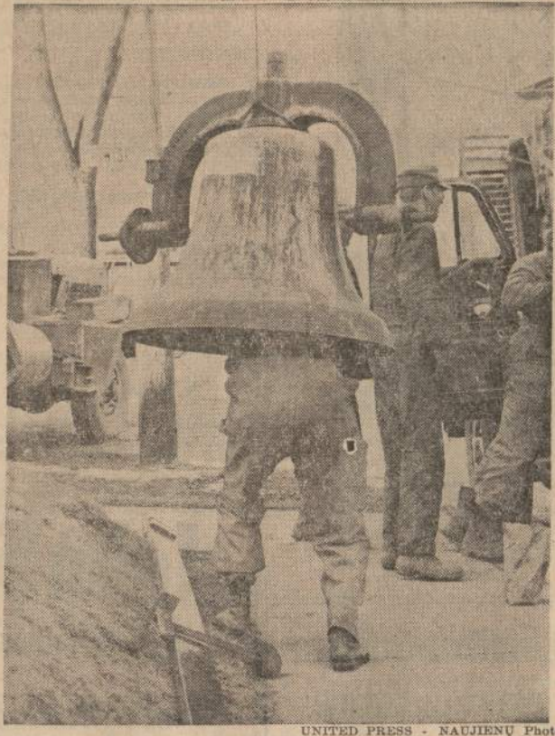
Šis varpas buvo nuimtas nuo 96 metų senumo Oconomowoc (Wis.) metodistų bažnyčios bokšto. Bažnyčia buvo nugriauta, o jos vietoje statoma nauja, kuri kainuos $255,000. Kai statyba bus baigta, tai tas varpas ir vėl bus įkeltas į naujosios bažnyčios bokštą.

WORLD PARCEL SERVICE 3320 SO. HALSTED ST. - CHICAGO 8, ILL. Tel.: YA 7-0677