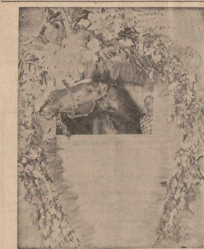
Candy Spots laimėjo Gulf Stream Park, Floridoje, surengtas arklių lenktynės bei $114,700 ir buvo apvainikuotas.

Skrendančios musės sparnai per sekundę suplasnoja 330 kartų.