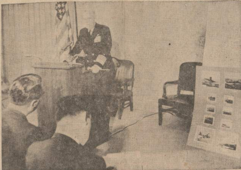
Laivyno viršininkas admiralas George Anderson Pentagone praneša, kad povandeninis laivas "Thresher" su 129 įgulos vyrais žuvo.

JAKARTA, Indonezija. — Greitasis traukinys Jakarta-Bandung nuėjo nuo bėgių ir nuvirto nuo pylimo į 250 pėdų daubą. Mažiausia 28 keleiviai žuvo, kiti 85 buvo sunkiai sužeisti.