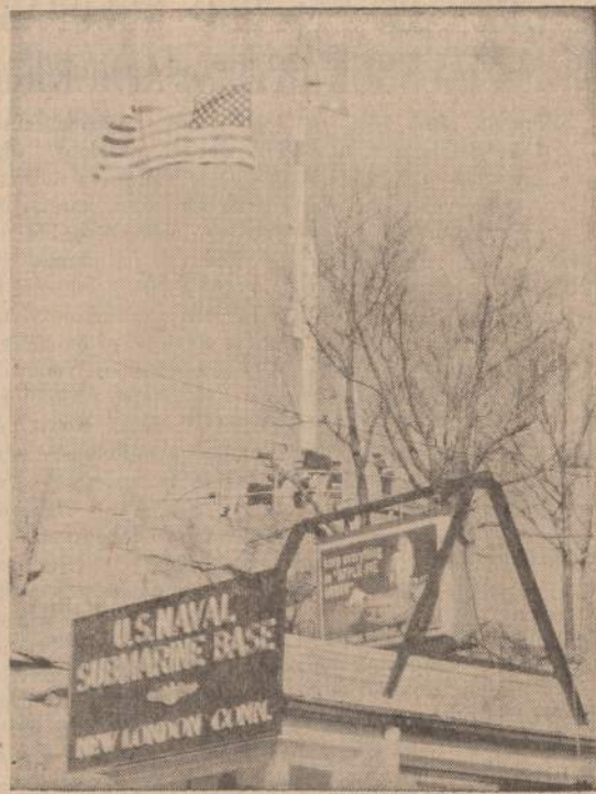
JAV laivyno povandeninių laivų bazėje, esančioje New Londone (Conn.), buvo nuleista pusiau stiebo vėliava, kai laivyno sekretorius Fred Korth oficialiai pranešė, jog povandeninis laivas "Thresher" su 129 įgulos nariais yra žuvęs.