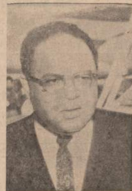
Kongresmanas Charles Diggs kalbasi su reporteriais po to, kai buvo įmesta pro langą bomba į namą, kuriame jis buvo sustojęs, kada nvyko į Clarksdale, Miss.

Bus duodamos dovanos: penkios už gražiausius margučius, trys už geriausiai pasirodžiusius talentus ir kitos už šokių kontestus — "Mamės ir papės polka", Jaunimo polka, valcas ir