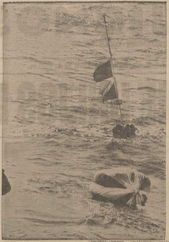
Atlanto vandenyne plūde afimnėta vieta, kur, kaip specialistai mano, nuskendo "Thresher" povandeninis laivas.

Lūnės Sutemos ir Kazio Bradūno eilėraščiai publikos ausiai buvo tartum švelni muzika. Abu du skaitė gerai, ypač Bradūnas, kurio balsas skambėjo, kaip vaidilos. Be abejo, K. Bradūno poezija yra suprantamiausia eili-