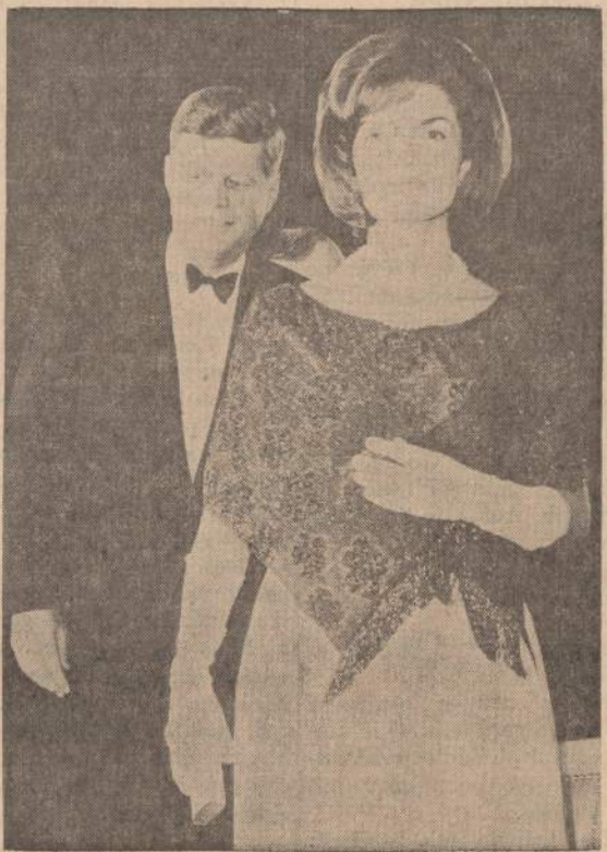
Iš Baltųjų Rūmų paskelbta, jog Jacqueline Kennedy rugpiūčio pabaigoje susilauks trečio kūdikio.