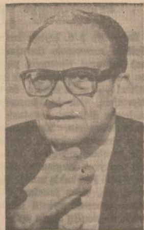
Amerikos vyriausybė pareiškė, jog Kubos egzilu vadas, Jose Miro Cardona, reikalauja iš Amerikos tokio įsipareigojimo, kuris "beveik kraštai" priverstų prie karo su Kubą.