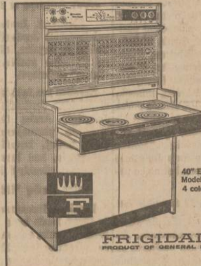
40" Electric Model RG18-645-2 4 colors or white