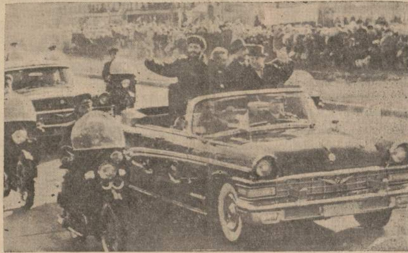
Kubos premjeras Fidel Castro (kairėje) ir Sovietų premjeras Nikita Chruščiovas mosikuoja sudirinkusiai miniai Maskvoje.