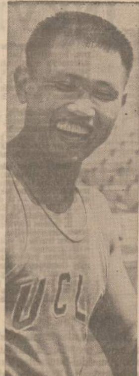
C. K. Yang patenkintas laimėjimu sportinių žaidynių pasaulio čempionato rungtynėse, kurios įvyko Walnut, Calif. Yang yra iš Nacionalistinės Kinijos.