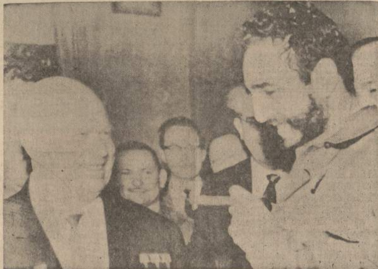
Kubos premjeras Fidel Castro ir Sovietų premjer as Nikita Chruščiovas dvi valandas konferavo Kremliuje.

Vilniaus radijo balandžio 8 d. žiniomis, visoje Sovietijoje įsigiję gerą vardą, pavergtos Lietuvos statybos ministerijos organizuojami traukiniai. Jais į Kazachstaną, kt. vietas gabenami įvairūs Lietuvos specialistai, jaunimas. Dabar vėl sustatytas traukinys su... klasiniais vagonais ir į Kazachstaną būsia gabenama ne tik 200 statybinių, bet ir įvairios statybos priemonės, buldozeris. Lietuvos statybinkai, pagal radiją, Petropavlovsko srityje statysią elevatorių. (E)