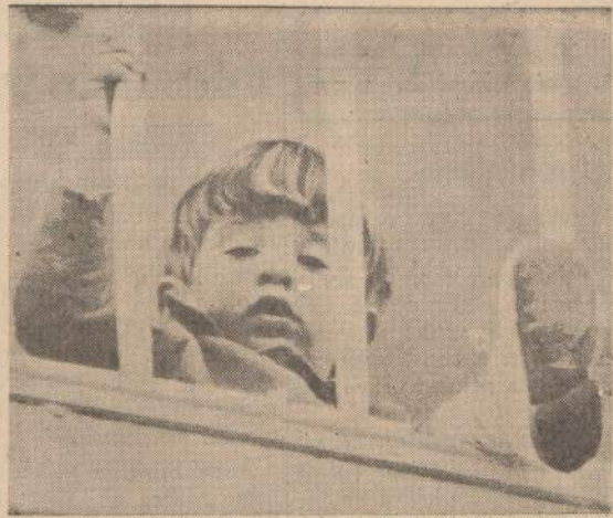
Prezidentas Kennedy Baltųjų Rūmų kieme pasveikino Garbės me- daliais apdovanotus per 200 asmenų. Jo sūnelis, John F. Kennedy, Jr., stebi tas ceremonijas iš balkono.

Ši skurdi "kaltinamoji" me- džiaga kalba prieš pačius oku- pantus. Ji, lygiai kaip ir visas straipsnis, parodo, kad Sovietų valstybėje nėra religinės lais- vės, kuri taip iškilmingai įrašy- ta jų konstitucijoje; nėra lais- vos religinės praktikos, kuri bū- tų leista; nėra teisės nešioti re- liginis ženklus, jeigu tikintieji to nori; nėra teisės paštu tokius dalykus pasiųsti ar juos pasiga- minti; nėra laisvės tėvams įra-