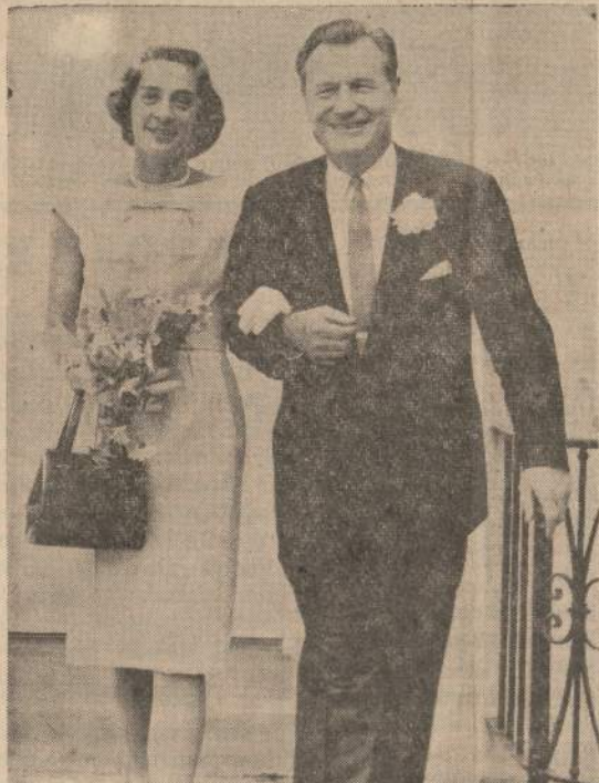
New Yorko gubernatorius Nelson Rockefeller ir jo antroji žmona, kurią jis vedė sekmadienį.

daugumą jau sudaro negrai (54%), padėtis pagal jų vadą Powell esanti tokia: 80% negrų yra tarp valdžios šelpiamųjų, 70% tarp beraščių, 90% tarp kriminalinių nusikaltėlių.