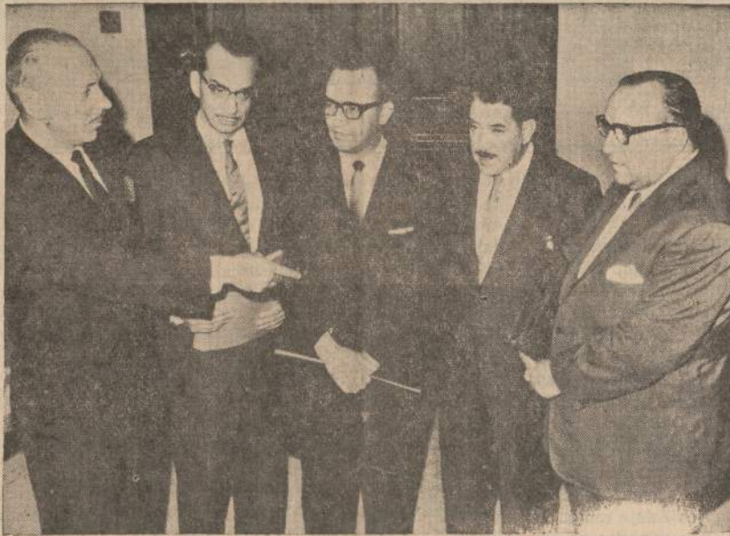
Amerikos Valstybių Organizacijos Taryba susirinko Washingtone aptarti, kaip išvengti karo tarp Haičio ir Dominikos respublikų.

Sovietai į šią bylą velia septynetą Amerikos diplomatų ir šešetą Anglijos. Wynne ir Penkovsky gali būti nubausti mirties bausme, ypač Penkovsky. Lengviausia bausmė už špionąžą yra 7 metai.