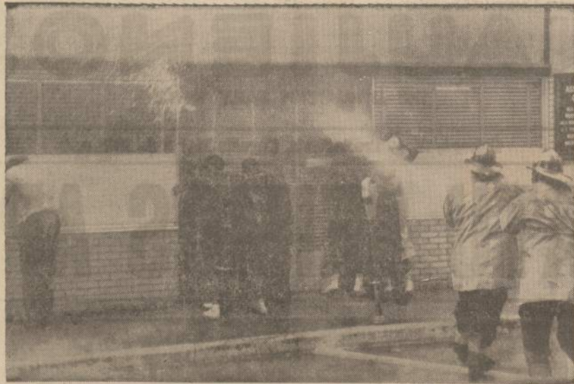
Birmingham (Ala.) policija paleido vandenį į protestuojančius negrus, kurių susirinko apie trys tūkstančiai.