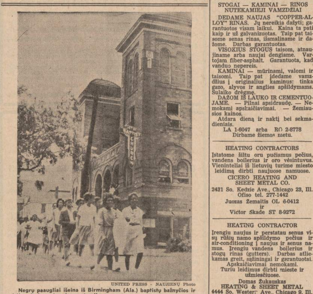
Negru paaugliai išeina iš Birmingham (Ala.) baptistų bažnyčios ir įsijungia į masinę demonstraciją.