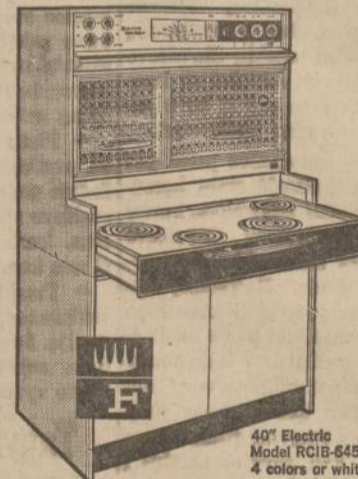
40" Electric Model RCIB-645-2 4 colors or white

Frigidaire Flair Range looks built-in but isn't!