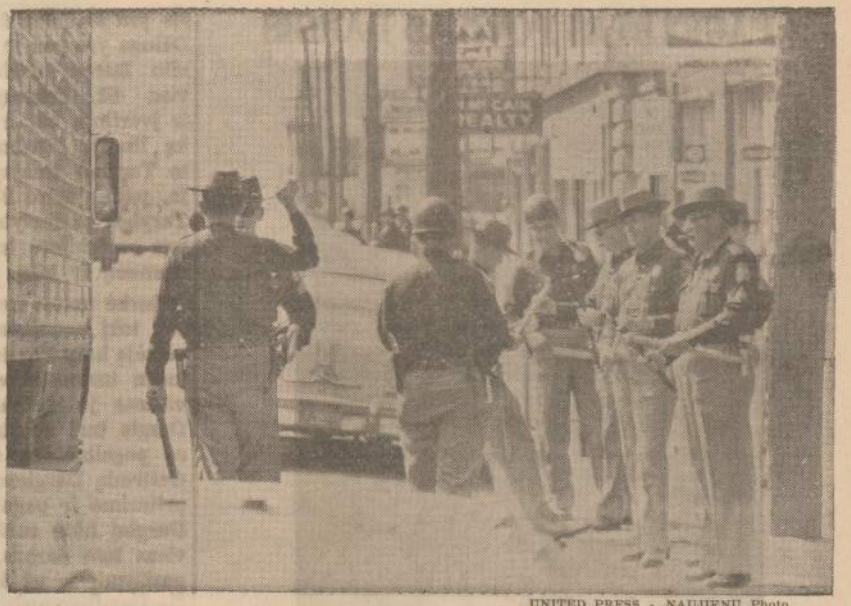
Alabamos gubernatorius George Wallace pašaukė valstijos policiją, kad ji padėtų Birmingham policijai suvaldyti rasines demonstracijas.