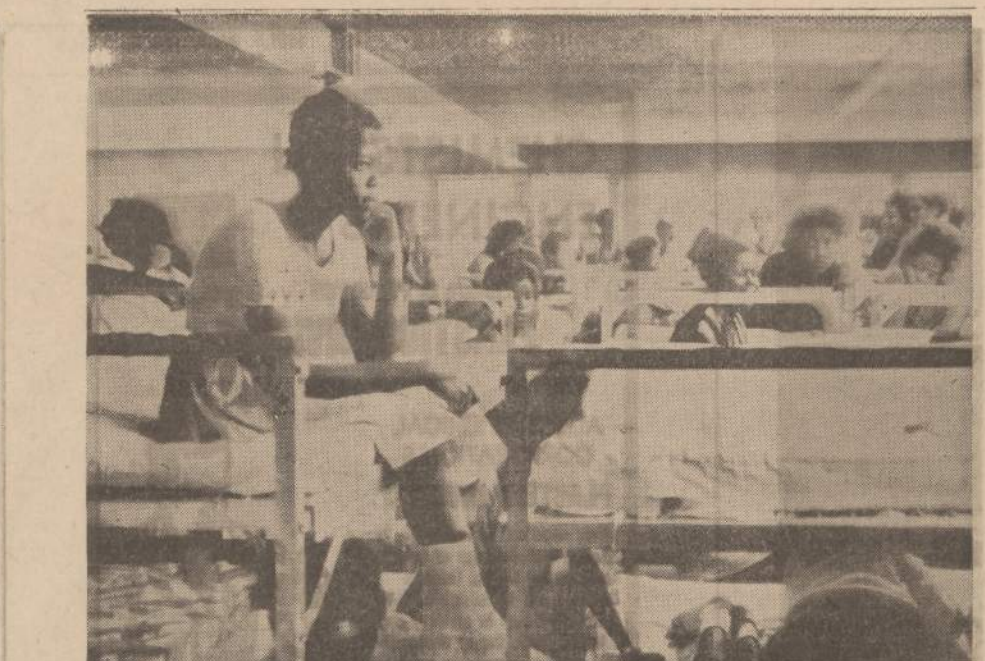
Už demonstravimą areštuotos negrės mokinės Birminghame, Ala., laukia kada paleis.

SOPHIE BARCUS RADIJO SEIMOS VALANDOS... 7159 SO. MAPLEWOOD AVE.