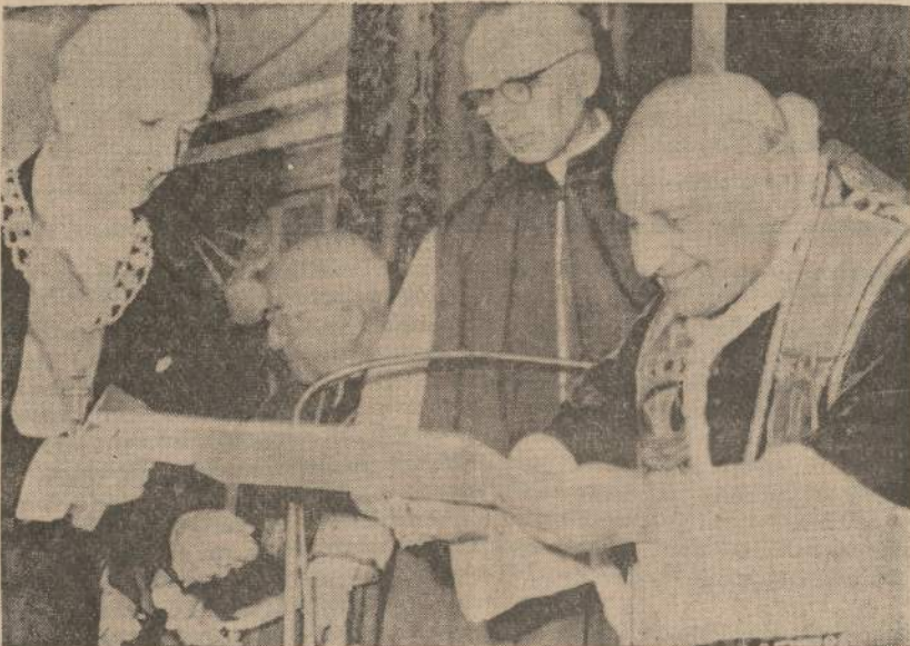
Italijos prezidentas Antonio Segni (kairėje) iškėlė popiežiui Jonui XXIII $160,000 Bazano taikos premiją Vatikano ceremonijų metu.