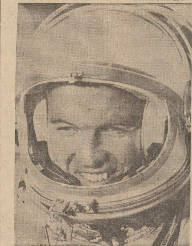
Astronautas L. Gordon Cooper, kuris yra numatomas ketvirtai erdvės kelionei aplink žemę. Kaip numatoma, erdvės kelionė truks 34 valandas ir 20 minučių apsisukant aplink žemę 22 kartus. Cooper čia parodomas Cape Canaveral (Fla.), kur buvo tikrinamas jo tinkamumas tokiai kelionei.