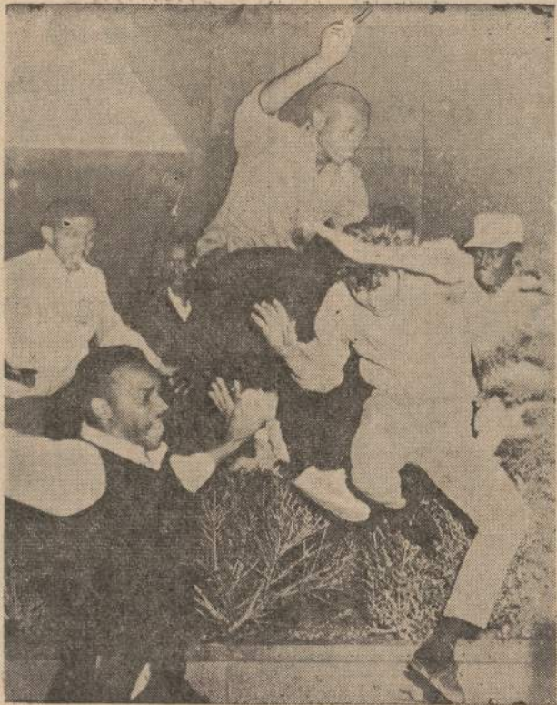
Nashville (Tenn.) įvyko muštinės tarp negrų ir baltaodžių, kai negrai surengė demonstraciją prie restorano, kur negrai yra nepageidaujami.