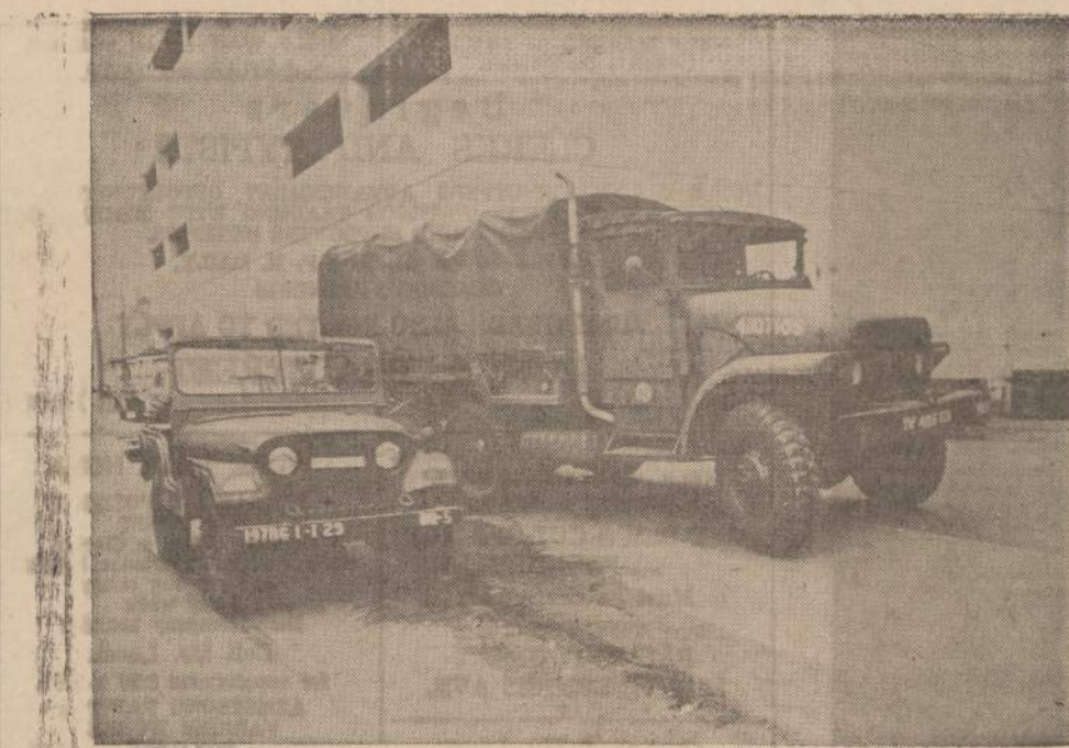
Apie 3,000 kareivių jau yra Birminghamo (Ala.) apylinkė. Kariuomenė sustojo netoli tos vietos, kur išstas keturias valandas siautė rasinės riaušės.