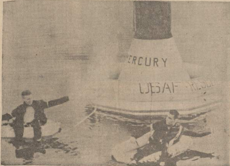
Rinktinė, kuri daro pratimus Hickam AFB bazėje, Havajuose. Jos pareiga bus ištraukti iš Pacifiko kapsulę, kurioje nusileis iš erdvės astronautas Gordon Cooper, apskridęs žemę 22 kartus.

Nežiūrint jos nusistatymo prieš kainų pakėlimą, teko paklusti tarptautinei orinių transportų sąjungai, kuri nutarė pakelti kainas Šiaurės Atlanto susisiekime. Anglija pasiūvė suvaidinti šio nutarimo vykdymo. Buvo pagrasyta TWA ir Pan-American kompanijoms, kad jų lėktuvai bus konfiskuoti anglų aerodromuose.