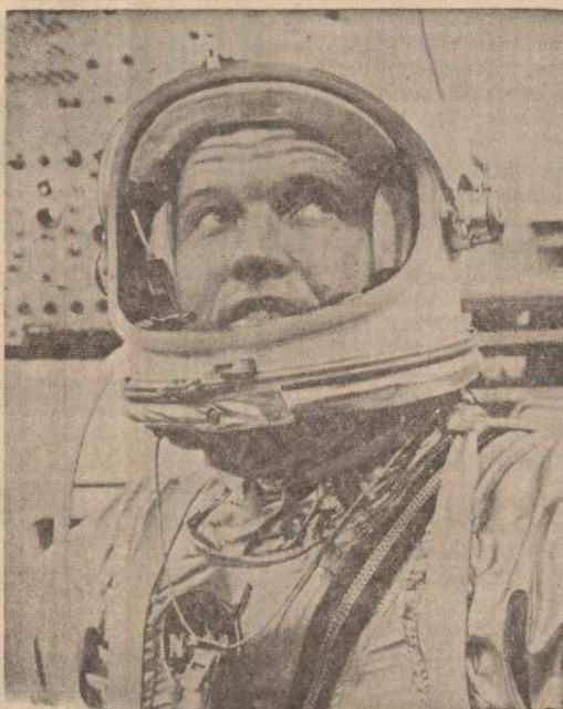
Astronautas L. Gordon Cooper buvo taip apsirengęs kelionėje aplink žemę.

Egiptas padeda išsilaikyti Jemeno revoliucinei valdžiai, kuri buvo sudaryta praėitų metų rugsėjo mėnesį, nuvertus karalių Mohammad al Badr ir įvedus respublikinę santvarką. Saudi Arabija teikia prieglaudą ir paramą nuverstajam karaliui ir jo kovotojams.