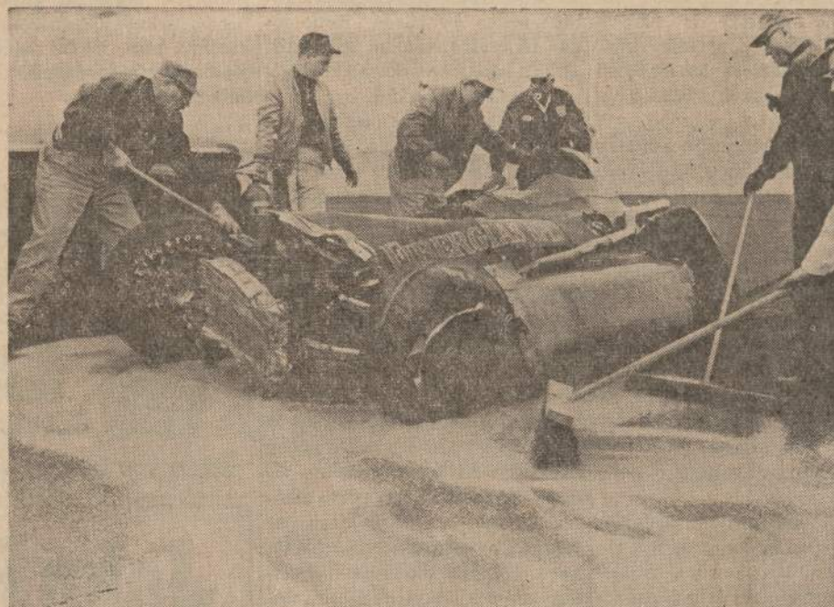
Indianapolio (Ind.) automobilių lenktynių aikštėje Curtis Turner darė su savo automobiliu bandymus, kurie baigėsi nelaimingai: nors pats nelabai skaudžiai tenkentejo, bet automobilį visiškai sudaužė ir negalės dalyvauti Kapinių puošimo dienos lenktynėse.

persikėlė į 2715 WEST 71st ST., CHICAGO 29, ILL. Tel. 471-1424