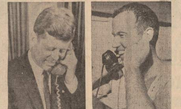
Prezidentas Kennedy (kairėje) iš Baltųjų Rūmų kalbasi su astronautu L. Gordon Cooper, kuris tuo laiku buvo USS Kearsarge lėktuvnešyje.

Japonija, kad ir nebūdamas Nato nariu, sutiko su JAV pasiūlymu vamzdžių neparduoti.