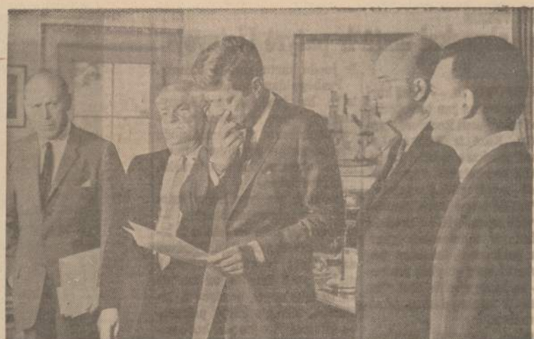
Prezidento taryba pasiūlė, kad geležinkelių kompanijos turi pradėti rimtas derybas su geležinkelinių uniomis išvengti streiką. Baltuosiuose Rūmuose prezidentas Kennedy žiūrį į tarybos pateiktą raportą.

miteto posėdžiai dės pastangų atitaisyti šios kilnių tikslų organizacijos padarytas didžiules klaidas. Pabrėžta, kad ir patys posėdžiai turėtų vykti laisvės sąlygose.