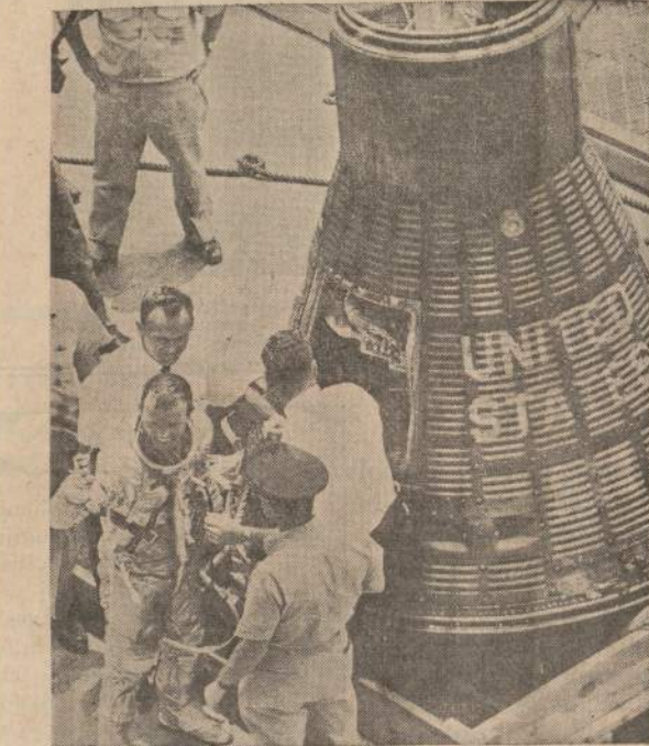
Astronautas L. Gordon Cooper išsina iš "Faith-7" kapsulės, kuri apsisuko beveik 23 kartus aplink žemę ir, kai nusileido į jūrą, buvo ištraukta ir įkelta į USS Kearsarge lėktuvnešį.