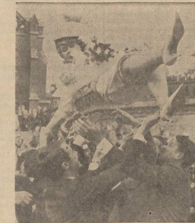
Devyniolikos metų švedijos princesė Christiana buvo Stockholm prancūzų mokyklos studentų iškelta į viršų, kai paaiškėjo, jog ji išlaikė kvotimus ir buvo priimta į universitetą.

Parodoje savo eksponatus išstatys apie 25 asmenys. Kadangi pagrindinis parodos tikslas žuvusiųjų transatlantinį lakūnų paminėjimas, tad daug eksponatų bus surišti į juos skridimu — Lietuvoje išleisti jų garbei pašto ženklai, specialūs vokai, žymiųjų žmonių atsiliepimai apie lakūnus. Visų eksponatų aprašymai bus specialus leidinėlis. Be to, bus daug įdomių ir retų pašto ženklų, vokų, pokarinių aliančių kontrolės korespondencijos Europoje ir daugelis kitų įdomybių.