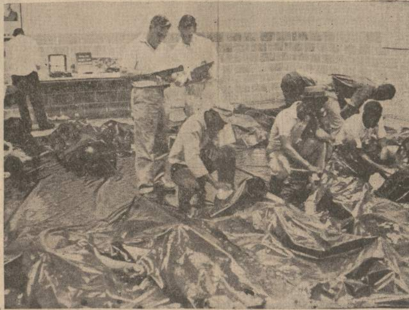
Važiuojant į Belle Glade, Floridoje, autobusui susirūrus su sunkvežimiu, 27 formų darbininkų, sykiu su autobusu įkrito į 25 pėdų gilumo kanalą. Išsigelbėjo tik vienas 12 metų negruikas. Čia matomi atpažinimui išstatyti žuvusiųjų lavonai.

Parkų draugija studijuoja ir kitus dalykus: parkų pagražinimą, takus, fontanus, suolus. Savo studijoj draugija pripažįsta, kad pirmasis uždavinys yra žmonių apsauga parkuose.