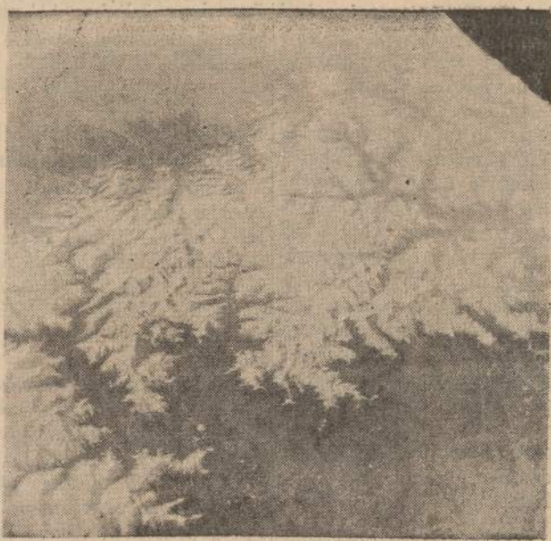
Tai Himalajų kalnų nuotrauka, kurią astronautas Gordon Cooper nutraukė, skridamas aplink žemę ir būdamas per 100 mylių aukštumoje.