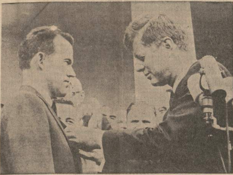
Prezidentas Kennedy prisega astronautui Gordon Cooper medalį už nuopelnus erdvių tyrinėjimuose.

♦ Havanos radijo tvirtinimu, Matanzas kalnuose buvo sunaikinta pagrindžio kovotojų grupė ir jos vadas.