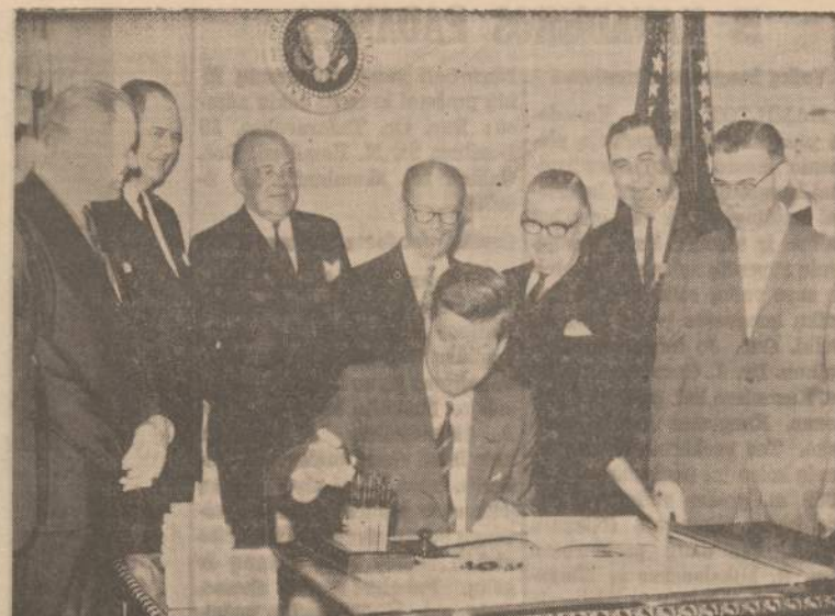
Prezidentas Kennedy pasirašo pasirašyti bilį, kurio pasirašinių grūdų programa bus pratęsta dar dviem metais. Toje bilijaus pasirašymo ceremonijoje dalyvavo senatoriai, kongresmanai ir fermerių organizacijų atstovai.

Kodėl lietuvių delegatai remia lenkus, kurie stovi už Rapackio planą ir puola JAV politiką, mums ne visai aišku. Lenkų rašytojas, gal būt, nėra pilnai bešališkas. Bet jei tiesa, ką jisai pasakoja, tai ar čia nebus kardinolo Wyszyński įtakos vaisiai?