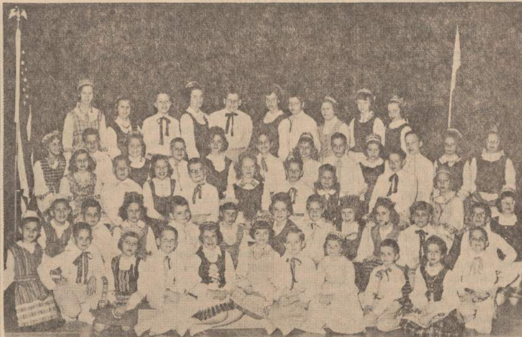
Ateities "Atžalynas", jaunieji šokėjai, kurie šoks 1963 m. gegužės 26 dienos Pavasarinėje Šventėje, vykstančioje Bučo Sode, Willow Springs, Illinois. Programa prasidės 2:30 val. po pietų.

Taip ir atsitiko, kai kitą rytą išaušo tikra pavasario diena ir apšepęs žemės veidas staiga pajauinėjo, pagražėjo ir čiabuviams ir praeilčiams vienodai maloniai susišypso-