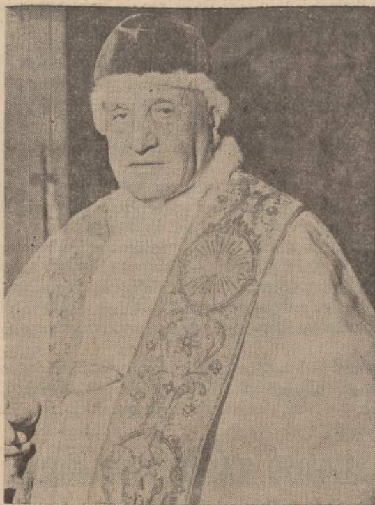
Daktarai pagaliau viešai pranešė, kad popiežius Jonui XXIII vestai nebegebsti. Popiežius kenčia nuo "nenormalaus augimo" viduriuose ir jo padėtis skaitoma kritiška.