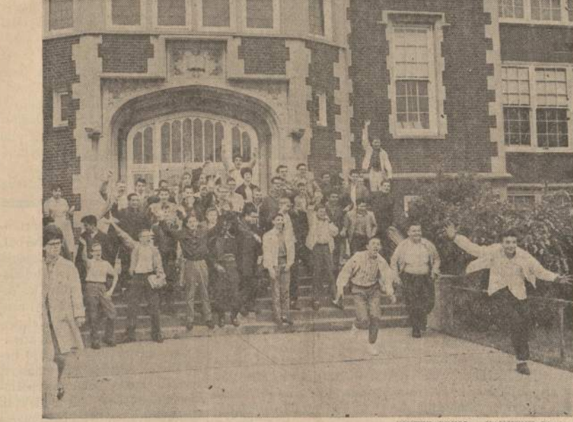
Apie 1,400 mokytojų susitikavus, visos 43 viešosios mokyklos Gary, Indianoj, buvo uždarytos ir 45,000 mokinių gražinti namo. Iš vaizdelio galima spėti, kad mokiniams tokios vakacijos patinka.