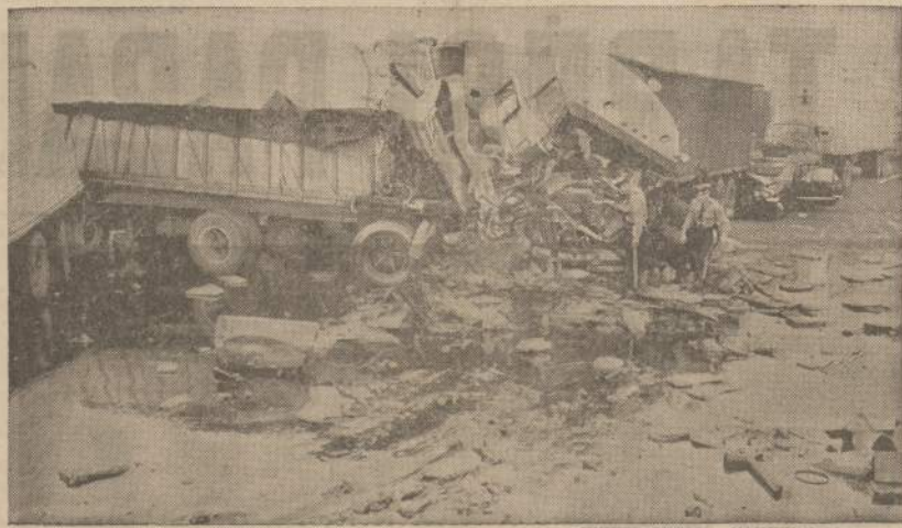
New Jersey autostradoje įvyko viena didžiausių eismo nelaimių, kai dėl nepaprasto rūko susidau- žė 14 sunkvežimių ir 3 automobilai. Nelaimėje žuvo šeši žmonės.