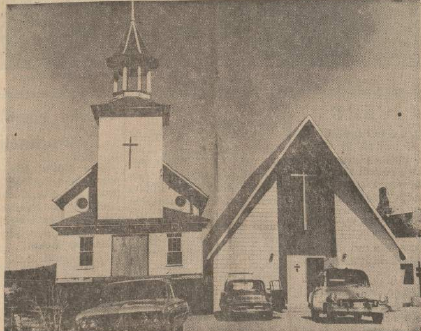
Lead'o (S. D.) senoji liuteronų bažnyčia buvo pекelta į kitą vietą ir paversta meno paminkliu pastatu.

Washingtono kongreso nariai siūlo uždrausti žuvų konservų įgabenimą iš Ekvadoro ir kitų kraštų, kurie nedraugiškai elgiasi su Amerikos žvejais.