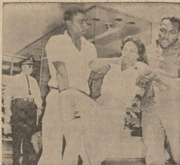
Jackson mieste, Mississipi, neša į policijos vežimą demonstrantę.