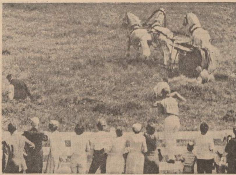
JAV milijonierius Cyrus Eaton rusiškų arklių troika jo farmoje prie Sagamore Hills, Ohio, pasidare nebesuvaldoma ir, vežimui apvirtus, išvertė tris jame važiuosius asmenis, svečius iš Rusijos ir Čekoslovakijos. Nef ir arkliai nemėgsta buvusiu šeimininku.

Šia proga negalima neatkreipti dėmesio ir nutylėti dėl tautininkų vieno iš vadų, J. Smetonos žiaurais ir obskurantiško