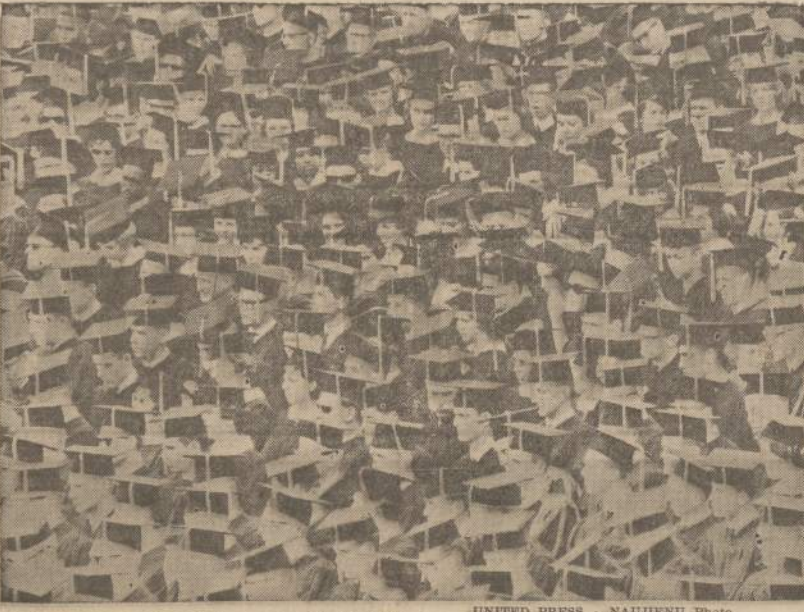
Indiano universiteto (Bloomington, Ind.) iškilmingos mokyklos baigimo ceremonijos.