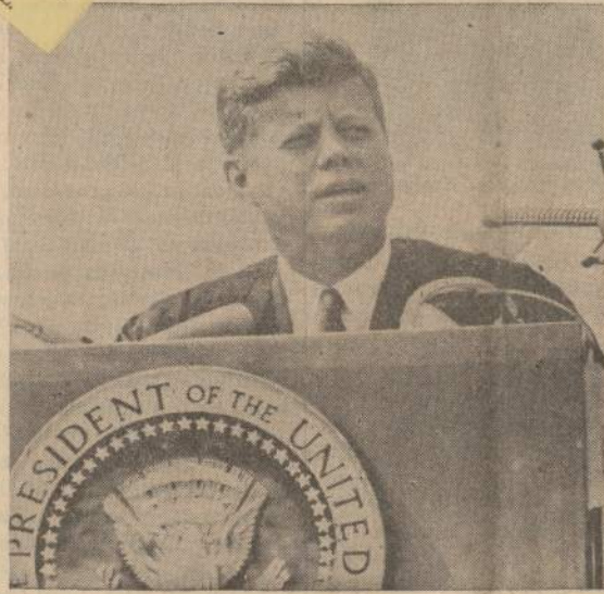
Prezidentas Kennedy, kalbėdamas American universitete Washingtono, pareiškė, jog JAV nebesprogdins branduolinių bombų ore, jei nuo to susilaikys sovietai.

Apie šį įvykį buvo plačiai rašoma Amerikos ir pasaulio spaudoj. Nemaža rašėjų naudojo šį incidentą Los Angeles policijos "brutališkumui" įrodyti.