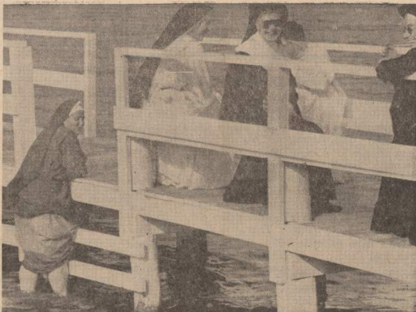
Vienuolės piknikauja prie Austin ežero, Texas, atvažiavusios iš St. Edwards universiteto, Austine, kur dalyvauja specialioje sesijoje.