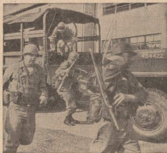
Alabamos tautinės gvardijos dalinys iš Fort McClellan atvyko į Tuscaloosą tvarkos palaikyti ryšium su dviejų negrų studentų noru užsiregistruoti Alabamos baltųjų universitete.

Prezidento Diem vyriausybė jau ir taip turi daug vargo, kovodama prieš komunistų partizanų, kurie būtų pilietinį karą seniai laimėję, jei Amerika nebūtų suteikusi pagalbos pinigais, ginklais ir instruktoriais.