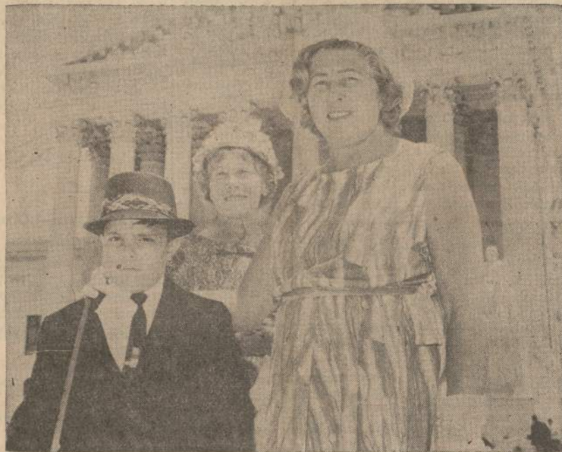
Madalyn E. Murray, iš Baltimore (Md.), ir jos sūnus William Murray po to, kai teismas išnešė sprendimą, jog skaitymas maldų ir biblijos viešose mokyklose prieštarauja Konstitucijos nuostatomis. Murray šeimos pastangomis maldų ir biblijos skaitymo klausimas viešose mokyklose ir atsidūrė Aukščiausiam Teismui.

Negras dar nėra pasiruošęs būti priimamas į baltųjų tarpą, kadangi jis nepajėgia sukurti darbų ir pasigaminti maisto. Jis tik prašo socialinės lygybės ir teisės valgyti prie pono stalo, pasakė Elijah.