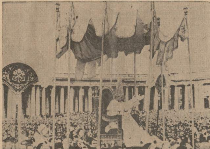
Popiežius Povilas VI, nešamas per Šv. Petro aikštę į apvainikavimo sostą, laimina susirinkusių žmonių minią. Apskaičiuojama, kad vainikavimo ceremonijoj pažiūrėti susirinko apie 520,000 žmonių.

Ant kojų pašoko ne tik delegatė, bet ir žiūrovai, 3,000 žmonių, susirinkusių į Kongresų Rūmus.