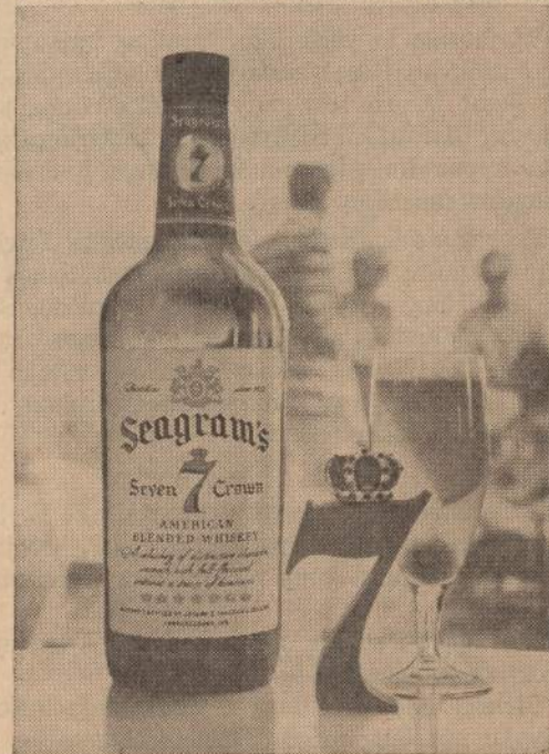
SEAGRAM DISTILLERS COMPANY, N. Y. C. BLENDED WHISKEY, 66 PROOF, 66% GRAIN NEUTRAL SPIRITS.

Visą vasarą sakyk Seagram ir būsi tikras.