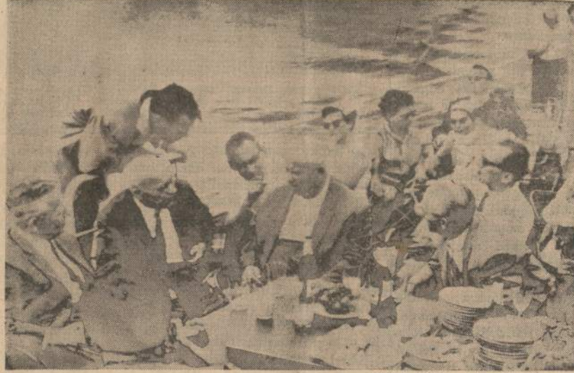
Sovietų Sąjungos Nikita Chruščiovas (centre) su satelitinio krašto komunistų partijų lyderiais laive Spree upėj Rytų Berlyne atlieka "slaptą viršūnių konferenciją". Sėdi iš kairės: čekoslovakijos prezidentas Anthony Novotny ir Lenkijos kompartijos sekretorius Vladislavas Gomulka.

Jo mirtis palieka didelę spragą lietuvių visuomeniniame judėjime. Jis buvo pareigingas socialistas demokratas ir nepaprastai doras lietuvis.