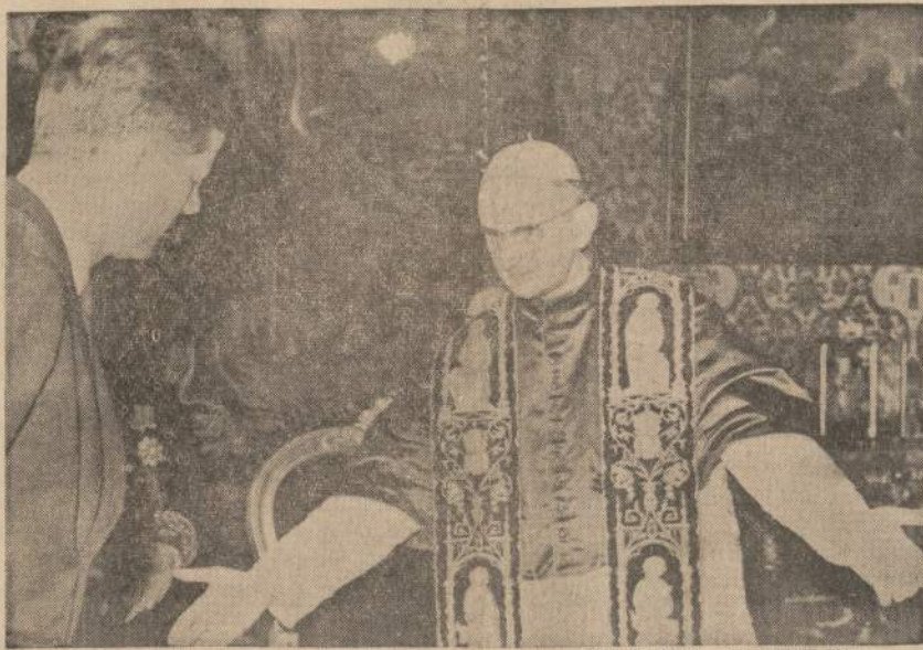
Popiežius Povilas VI pasitinka Vatikane prezidentą Kennedy.