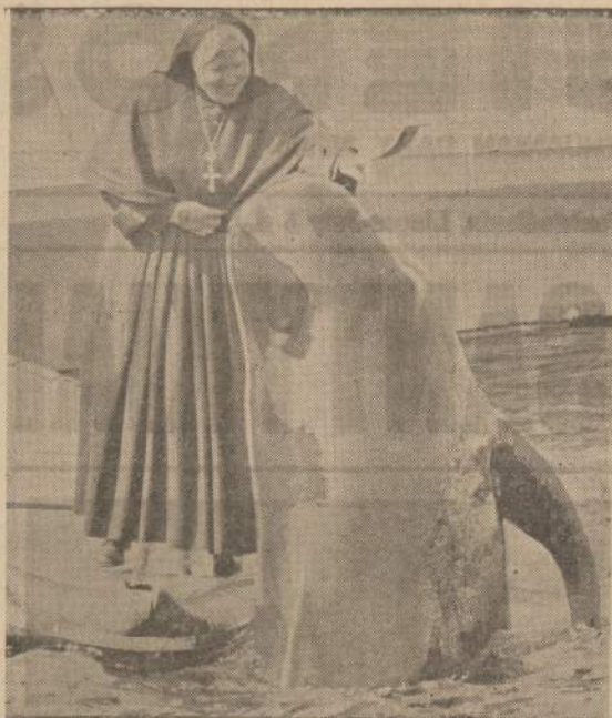
Paolos Verdes (Calif.) akvariumo banginis "sveikina" naujai atvykusią iš New Yorko valstybės vienuolę, kuri mokytojauja kitoje gatvės pusėje esančioje kolegijoje.

• Tėvo diena yra panaši į motinos dieną, tik tas skirtumas, kad dovanos daug pigesnės. Anonimas