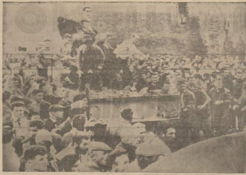
Prie Perpignan, pietinėje Prancūzijos dalyje, juze okininkai dėl žemų kainų surengė demonstraciją ir apmėtė pomidorais miliciją. Okininkų nusamdyti smogikai išvartė prekystalius, kur buvo pardavinėjamos užsienio prekės.

● Sunys, kurie savo tarpe rieda, beregint susitaiko vilką susitiktę. Armėnų priežodis