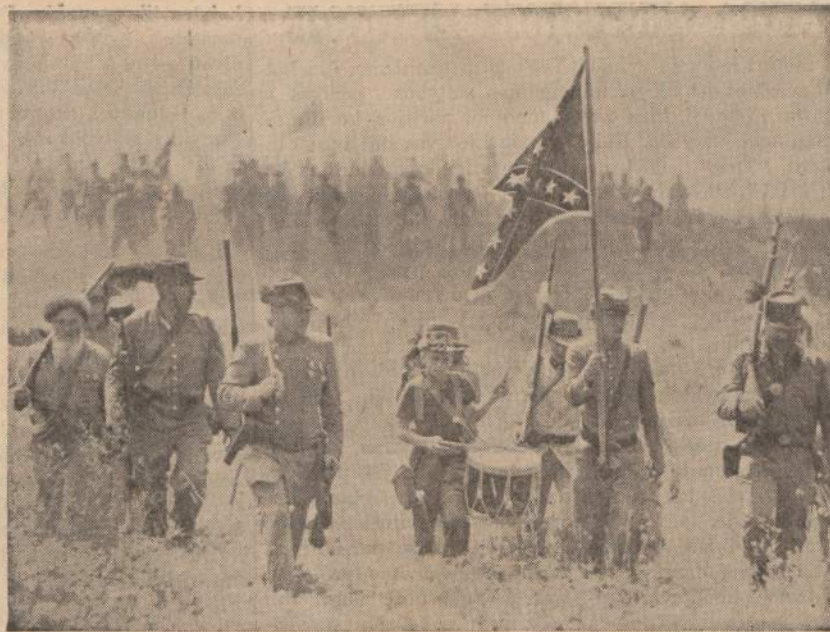
Prieš šimta metų įvykusio Gettysburg mūšio pavaizdavimas. Tai buvo vienas lemiamų Amerikos pilietinio karo mūšių.