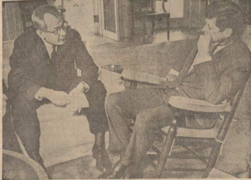
Prezidentas Kennedy tariasi su darbo sekretorium W. William Wirtz. Pasitarimas įvyko ryšium su geležinkeliečių unijos grūmojimu skelbti streiką.

Jiedu buvo paruošę įstatymo projektą apie unijų tvarkymą ir jų santykius su darbdaviais. Projektą priėmus, vyriausybė būtų turėjusi didelę galią unijose. Jos užtai paskelbė visuotinį streiką. Rasiniai santykiai per tas streiko ir riaušių savaites dar daugiau pastrėjo.