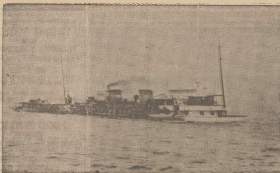
Uptių laivas "Ciudad de Asuncion", įvykus eksplozijai, grimsta La Platos upėje 50 mylių nuo Buenos Aires. 40 žmonių žuvo. Nelaimė įvyko laivui užplaukus ant paskendusio greitkio laivo.

ninkai buvo stipriai organizuoti ir valdžios palaikomi. Įdomu, kokią pažangą būtų padarę Lietuvos ūkininkai per kita 20 Ne-priklausomos Lietuvos metų? Sovietų okupacija pakeitė Lietuvos ūkininko gyvenimą priešinga kryptimi. Jis neteko savo nuosavybės; žemės, gyvulių ir ūkio padargų. Iš ūkininko paverter darbininku - kumečiu ir žymi dalis atsidirė Sibire.