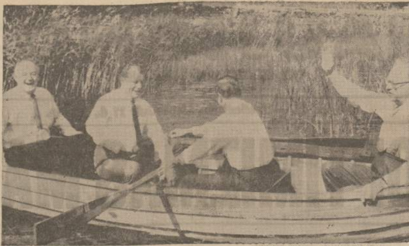
Svedijoje įvyko ekonominė ir unijų konferencija, kurioje dalyvavo keliu valstybių atstovai. Čia parodyti kai kurie tu atstovai, kurie laisvalaikį praleido beplaukiadami laiveliu Stockholmo srityje. Iš kairės į dešinę: Senatorius Hubert Humphrey, Vakarų Berlyno burmistras Willy Brandt, automobilijų dirbtuvių darbininkų unijos prezidentas Walter Reuther ir Svedijos premjeras Tage Erlander.

Prieš renkant naują valdybą vaidintojų buvo pasisakyta, kad į valdybą sutiktų įeiti daugiau tokių sambūrio narių, kurie nevaidina, bet galėtų atlikti administracinius ir kitokius darbus. Kai patiems vaidintojams tenka repetuoti ir atlikti spektaklio paruošiamuosius darbus, esą per daug vaidintojai apsunkinami. Tačiau, kaip tik prieita prie valdybos rinkimo, dalis susirinkimo dalyvių pakilo, atsi-