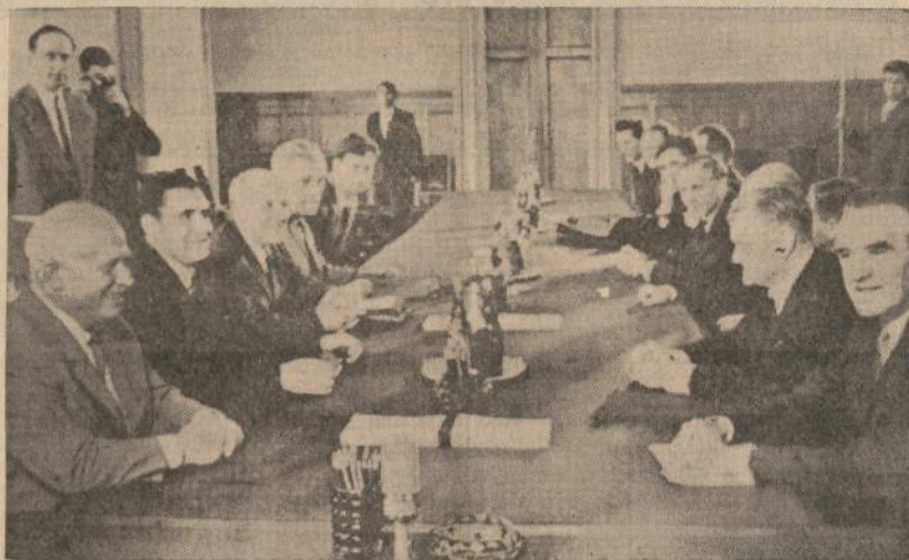
Kremliuje prasidėjo derybos dėl branduolinių bombų bandymų uždraudimo. Dalyvauja (kairėje): Nikita Chruščiovas, Andrei Gromyko ir jo pavaduotojas Valerian Zorin; (dešinėje): Amerikos atstovas W. Averell Harriman ir Anglijos atstovas Lordas Hailsham.

WASHINGTONAS, D. C. — Žemės ūkio departamentas apskaičiavo, kad prekyba tarp Sovietų Sąjungos ir komunistinės Kinijos sumažėjo nuo 1959 metų perpus. Prieš ketvertą metų šių dviejų didžiųjų komunistų šalių prekybos apyvarta siekė 1,8 bil. rublių. Praeitais metais besiekė 800 mil. rublių.