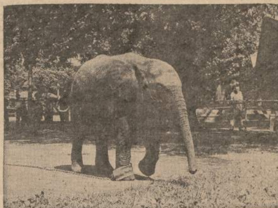
Dramblinė Elka prižiūri parkuose švara ir tvarką

Chicago parkų vadovybė prie aukščiau dėdamo atvaizdo padėjo tokį parašą: "Lindolno parko zoologijos daržo Elka — dramblė — štai ką sako: — Jums nėra reikalo turėti tokią gerą atmintį kaip mano, kad žinotumėte, jog visada reikia parkus ir paplūdimius švariai užlaikyti. Ar žinote, kad piknikų ir maudymosi sezonas kaštuoja apie $126,000 vien už atmatų nuvalymą ir pašalinimą. Tų išlaidų būtų galima išvengti, jei žmonės parkuose ir paplūdimiuose visas atmatas sumestų į tam tiksliai pastatytas statines.