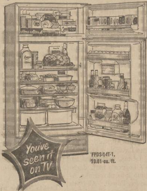
FPDS-147-1, 19.81 cu. ft.

10 days only during our Frigidaire Quota Sale! You've seen it on TV FRIGIDAIRE STAR of the BEST BUYS!! This is the best of the Best Buys. The refrigerator that will give you more for your money than any other we know. And for the next few days, we're offering you an even bigger value in order to make the sales quota we've set. Hurry!