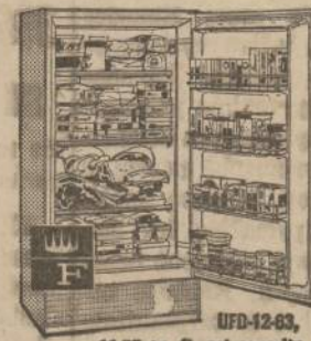
UFD-12-63, 11.55 cu. ft. net capacity