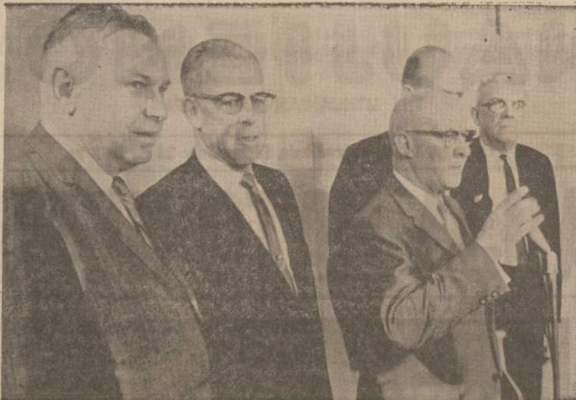
Derybose su geležinkelių kompanijų atstovais Washingtono dalyvavę geležinkeliečių unijų atstovai.