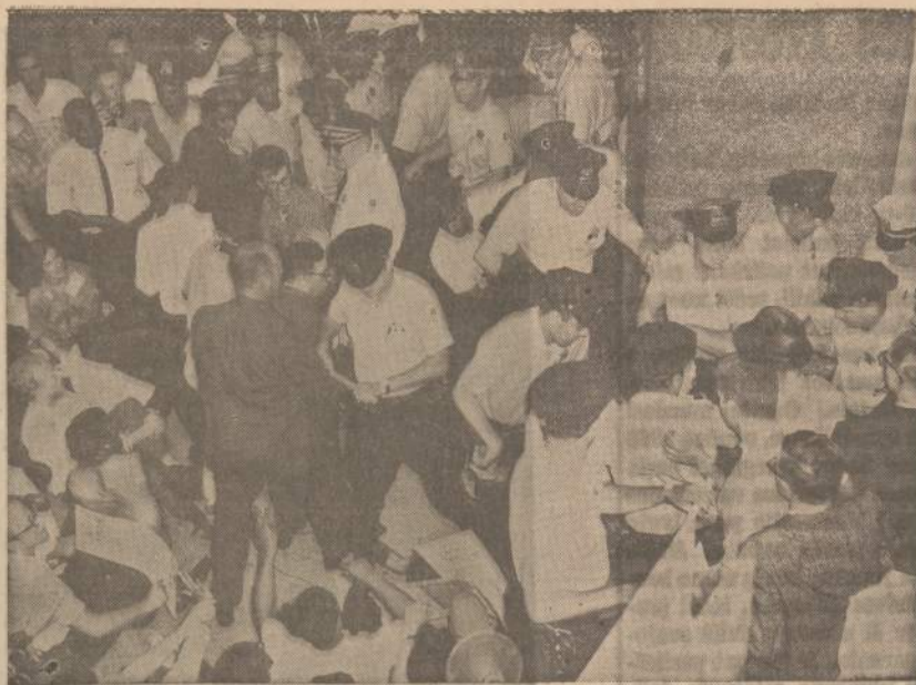
Prie Chicago švietimo tarybos trobesio įvyko demonstracija ryšium su menama segregacija viešose mokyklose. Demonstracija baigėsi apsisūdomų su policija. Trys policininkai ir viena dešimties metų mergaitė buvo sužeista.

Tegu ji pajuosasi su Peipingo tironija. Juo pikčiau jos pjausis, juo geriau.