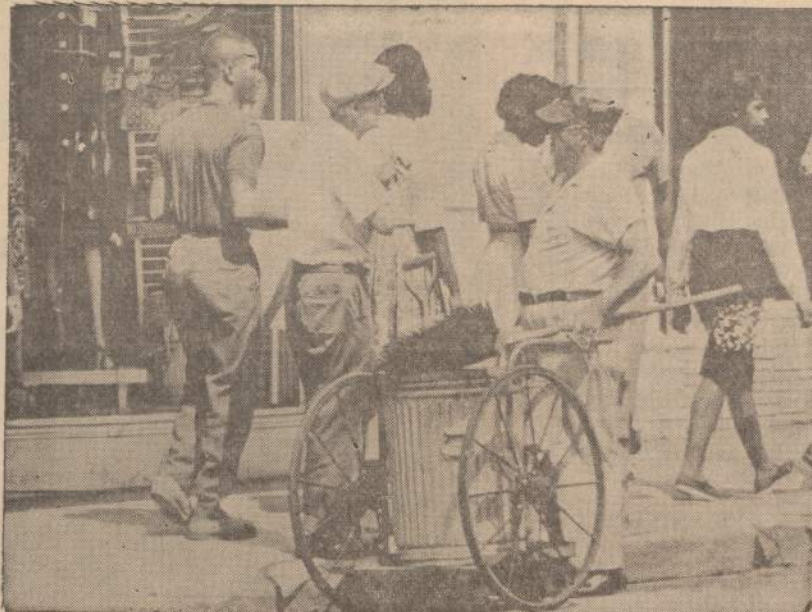
Du Charleston (S. C.) gatvių šlavikai nekreipia jokio dėmesio į negrus, kurie surengė demonstraciją.

Salos jau nuo praeitų metų kai kurios yra pažįstamos: čia "Kamino sala", o ten "Tamsioji sala", ir dar kitos pažįstamos, kurių vardų nežinau. Bet jos visos yra savotiškai gražios ir tos, ant kurių turtingiausiai išsistatę palocius kaip pilis, ir tos,