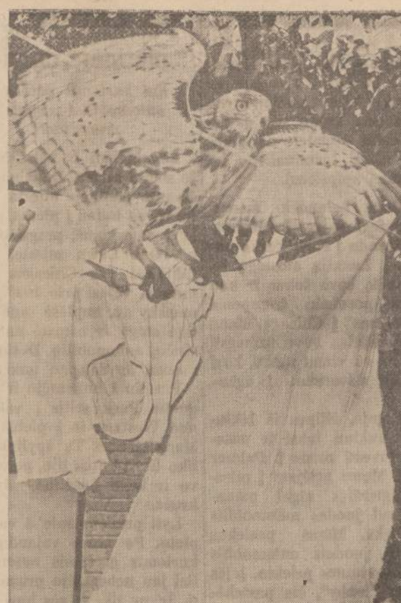
Jaunikis vištvanagis įskrido į Zilmon Pope'ų kiemą (Lorain, Ohio). Paukštis buvo pagautas. Dabar jis rodomas publikai.

Policijai atskubėjus, piktapabegti. Jis pripažino piktadarys, peilį nometęs, bandė sėdėjęs kalėjime už plėšikavimus.