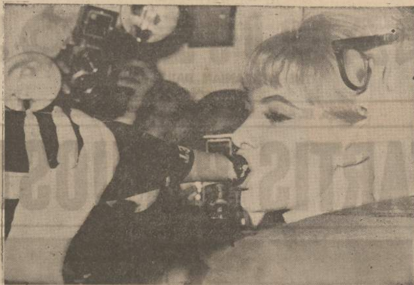
Mandy ramina troškūj. — Angliška mergina Marilyn-Mandy Rice-Davies amerikoniškai traukia prancūzišką šampaną daktaro ir dailininko Dr. Stephen Wardo dailės darbu parodoj Londone. Dr. Ward yra kaltinamas prostitucijų parūpinimu aukštajai britų visuomenei kaip karo ministeriui Profumui. Mandy tvirtino teisme, kad ji turėjo intymių reikalių su Douglas Fairbanks, Jr., konigaikščiu Astor. Abu jos tvirtinimus paneigė.