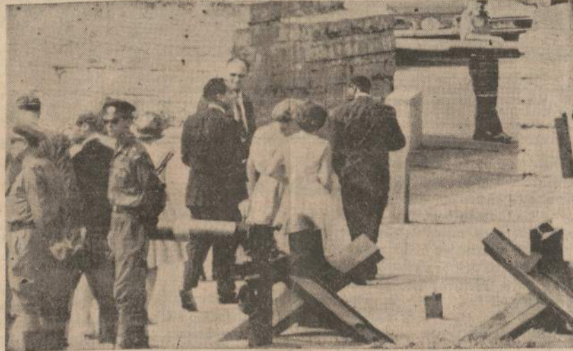
Buvęs viceprezidentas Richard Nixon, jo žmona ir jo dvi dukterys aplankė komunistų kontroliuojamą rytų Berlyną.