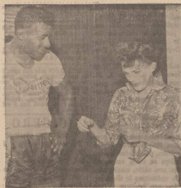
Boksierius Floyd Patterson aiškina aktorėi Judy Garland, kokios strategijos jis laikysis rungtynėse su Sonny Liston dėl pasaulio čempionato.