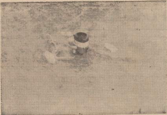
Prie Quebec City (Quebec, Kanada) nuskendo angly Tritonica prekinis laivas po susidūrimo su Roonagh Head laivu. Aštuoniolikos žuvusių lavonai jau surasti, o kiti šešiolika tebeieškomi.