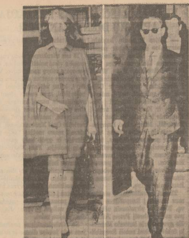
Christine Keeler ir Stephen Ward eina į Old Bailey teismą Londono, kur nagrinėjama jų byla. Jis yra kaltinamas parūpinimu paleistuvių žymiems asmenims, įskaitant buvusį ministrą John Palfumo.

Illinojaus valstybinė darbo įstaiga (Employment Service) kviečia jaunas, mėgstancias mechaniką, vyrus pasinaudoti gera proga, nemokamai išmokyti auto-mechaniko amato. Liepos 29 dieną prasideda pirmasis kursas, rugpjūčio 26 d. antrasis. Kursai truks 48