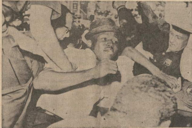
Policija tūso su piketininkais, kurie surengė demonstraciją Brooklyne, N. Y., prie statomo medicinos centro, protestuodami prieš statybos darbininkų uniją, kad toji vertojanti diskriminaciją prieš neirus.

Malajos, Indonezijos ir Filipinų užsienio reikalų ministrai neseniai pašalino savitarpiniais vaidus. Visi kėsinosi į britų kolonijas Borneo saloj. Buvo nutarta liepos 30 dieną sušaukti šių trijų šalių vyriausybės vadų konferenciją svarstyti plačią federaciją iš Indonezijos, Filipinų ir Malajijos (Malajos plius minėtas britų kolonijas). Prez. Sukarno nebeturi konferenciją važiuoti. Brunėjos sultanas, jo kurtomas, atsisakė įstoti į Malajijos federaciją.