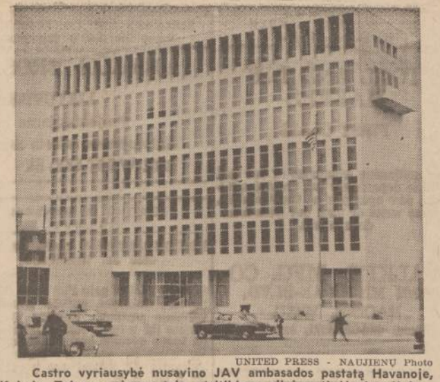
Castro vyriausybė nusavino JAV ambasados pastatą Havanoje, Kuboje. Tai esąs pirmas toks atsitikimas diplomatinėje istorijoje.

$2 ir pareikšdama, jog Naujienu 50 savo gyvavimo metų aukų neprašė, tad dabar mes turime joms padėti naujas mašinas įsigyti.