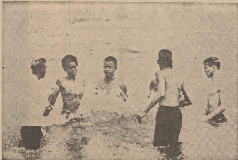
Du negrai jaunuoliai ir negrė mergaitė buvo Savannah Beach (Ga.) paplūdimyje areštuoti, kai jie bandė maudytis tik baltaodžiams skirtoje vietoje.

Sen. T. J. Dodd Penki Punktai Garbės žymenų įteikimo laisvės žymūnams iškilmėms vadovavęs, senatorius T. J. Dodd savo baigiamajam žody tarp kitko pareiškė, kad atmetas tą defetistinę filosofiją, kuri išpažįsta, kad tautoms iš sovietinės vergijos kelio į laisvę nėra, ir tokiam keliui pastatyti senatorius pateikt šias penkis sąlygas: Laisvasis pasaulis privalo pavergtųjų tautų bylą kelti kiek-