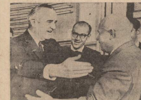
"Nėra amžinų priešų"... Nikita Chruščėvas ir valstybės psekretorius Averell Harriman puola viens kitam į glėbį po sudarymo atominės sutarties, kuri, jų manymu, skins kelį į susipratimą ir pasaulinę taiką.

Anglija, Italija, Austrija, Graikija ir kitos kaimyninės valstybės gelbsti nukentėjusiems kiek ir kuo gali. JAV ambasadorius George Kennean ir 40 ambasados tarnautojų paaukojo kraujo. Apie 10,000 gyventojų yra sužeista.