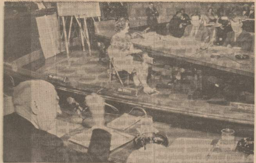
Sen. Sam J. Ervin (kairėje), Senato juridinio komiteto narys, ginčijasi su generaliniu prokuroru Robert F. Kennedy (dešinėje) dėl administracijos siūlomo įstatymo ryšium su pilietinėmis teisėmis.

Susiradęs viešbutį, einu palaukti, kaip miestas atrodo. Man pirmiausia krito į akį miesto tvarka. Kaip tai, kad jokio policininko gatvėje nesimato. O ir pravažiuojančių nėra. Dvi