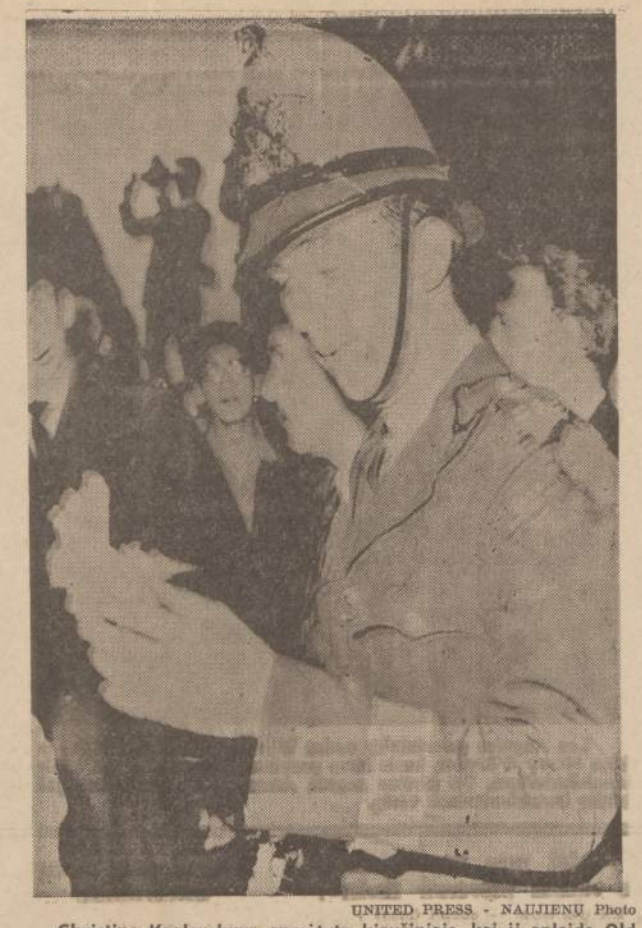
Christine Keeler buvo apmėtyta kiaušiniiais, kai į aplėdo Old Bailey teismo rūmus Londone, kur yra nagrinėjama dr. Stephen Ward'o byla.

MOVING APDRAUSTAS PERKRAUSTYMAS IS TOLI IR ARTI... 2022 W. 69th Chicago 36, Ill. Tel. WAlbrook 5-9209