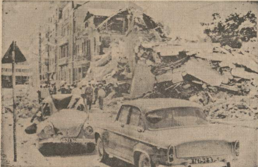
Katastrofa Jugoslavijoje. — Šitaip atrodo didžioji dalis Skopje mieste Jugoslavijoje po baisaus žemės drebėjimo praėjo penktadienio naktį. Miestas su 250,000 gyventojų buvo 80% sugriautas. Kiek žuvo žmonių, paaiškės po griuvėsių atkasimo, spėjama, nuo 1,000 iki 5,000. Apie 10,000 yra sužeista, apie 100,000 žmonių yra be pastogės.