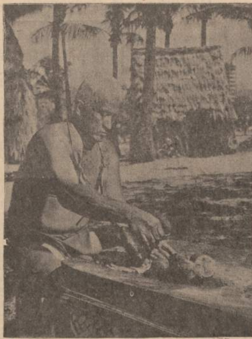
Havajų salų gyventojas ruošia jauna paršiuką kepti. Gerai paruoštas paršiukas, kelias valandas pašutęs smilkstancioje ugnyje, nepaprastai skanus.

Saulė pamaži vėl sušvinta visoje pilnybėje ir, lengvai atsidusę, visi išsiritam iš palapinių: visų akys, rodos, tvarkoniai lietuviškai pasveikina. Tiesa, beveik visi veidai ir pa-