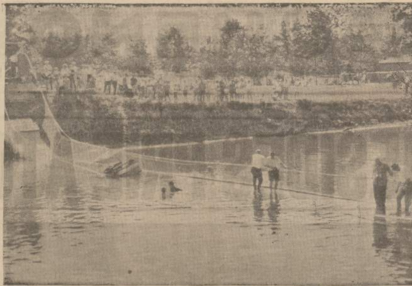
80 žiūrovų, kurie buvo susirinkę moterų golfo rungtynių pasižūrėti, sukrito į Clinton upę, kai susmužo kabantis tiltas. Nemažas skaičius nukentėjusių buvo nugabanti į ligoninę. Rungtynės vyko Mt. Clements, Mich., golfo aikštėje.