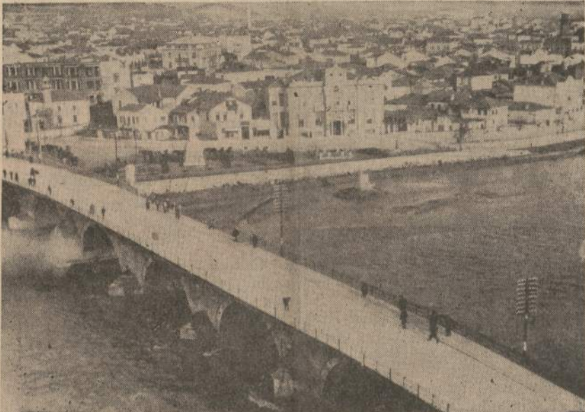
Didelis žemės drebėjimas. — Vaizdas iš Jugoslavijos, Makedonijos provincijos sostinės Skopje, kur naktį į penktadienį buvo didelis žemės drebėjimas. Miesto nuotrauka daryta 1941 metais.