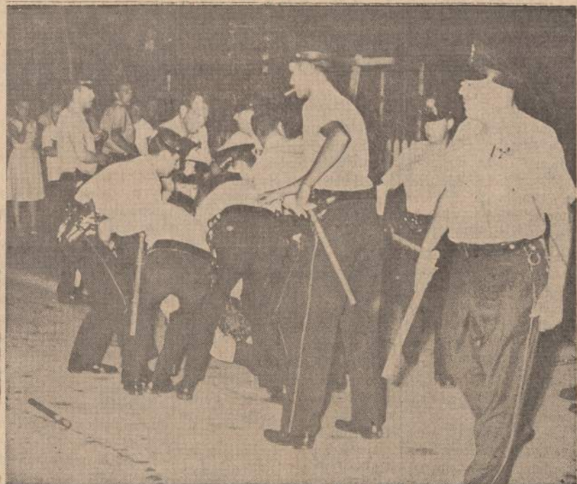
Chicago policininkai tūso su demonstrantu, kuris buvo areštuotas, kai prie vieno namų buvo padėtas penkių pėdų degantis kryžius.

Skaitant diskusijų medžiagą labai aiškiai matyti, kokius klystkelius priėjo kai kurie rašytojai, kur jie raginami ieškoti kūrybinio išsigelbėjimo ir įkvėpimo. Kur kūrybos kryptis — į gyvenimą ar nuo jo, į dabartį, ar nuo jos? Į akis krinta diskusijos dalyvių atitrūkimai nuo dabarties, nuo gyvenimo problemų. Pasirodo, kad dabartis emigracijoje nesuteikia rašytojams kūrybinio impulso, jie bėga nuo šito gyvenimo, bijodami jo problemų. Rašytojai raginami atsukti į praeitį, tūkstantmečius atgal ir ten ieškoti darbo savo plunksnai. Kai kurie diskusijos dalyviai nepatenkinti, kad "romanuose per daug entuziastingai vaizduojami skurdžiai, nevenigiant pašiapos lietuvių didikams", kad "lietuvių rašytojai privalėtų atsakyti bakūzių kulto", o "ieškoti visuotinių temų". O "visuotinė temom" šitas ragintojas supranta išsivadėjimą atspindinti tautos gyvenimą, kosmopolitinę dvasia apkrėstus kūrinius. Vienas diskusijose kalbėjęs tiesiog pareiškė, kad užsienyje gimę ar augę lietuvių vaikai negali mylėti kūrinių, kur jie skaitytų apie lietuvių kaimietį. Suprantama, kad "veiksniams" nemalonu literatūroje matyti bakūzes ir vargingus valstiečius. Juk buržuazijos valdymo metais jie rūpinosi tik savo turtais. Vadinas, vaizduoti kaimą su ba-