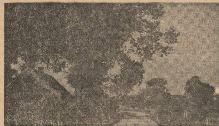
Vaidelis iš nepriklausomos Lietuvos laiku

Kadangi kovoje prieš Lietuvoje nepaprastai paplitusį alkoholizmą, girtuokliavimą negalima apsiriboti tik įstatymų numatytais kovos būdais, tai dabar jau šaukiama: vėskite aiškinamąjį, auklėjamąjį darbą. Mokytojai, teisininkai, gydytojai raginami sustiprinti priešalkoholinę propagandą, nes iki šiol ji buvusi silpna ir proginė. Skatinama dar daugiau galvoti apie lietuviškąjį jaunimą, nes ir jam nesvetimas girtuokliavimas. Sveikatos apsaugos ir Kultūros ministerijos paragintose organizuoti antialkoholines paradas, o svaigalų žalą turėtų vaizduoti ne tik spauda, bet ir kina per apžvalgas, kronikas. Sakoma — turės mažėti nusikaltimai, kils moralė, nes... kovojama už naują, "komunistinę visuomenės žmogų". O juk tikrumoje tos kovos už naują žmogų apsvaiginti piliečiai dar labiau skandinas degtinėje ir dažniau vykdo įvairius nusikaltimus. (E)