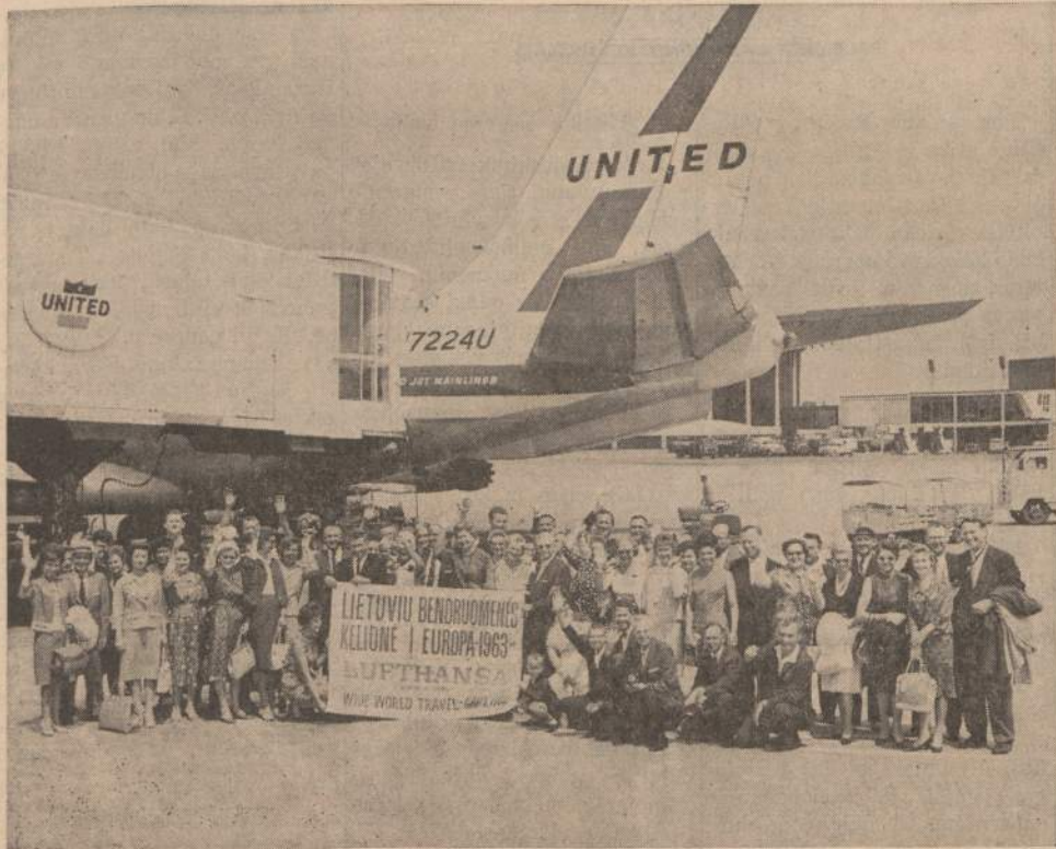
Šimtas dvidešimt keturi žmonės išskrido į Vakarų Europą

Praeitą antradienį, liepos 30 dieną, iš New Yorko į Vakarų Europą išskrido 124 lietuviai. Tai pati didžiausioji Amerikos lietuvių ekskursija, bet kada iš Amerikos skridusi į užsienius. Nepriklausomos Lietuvos laikais Lietuvon vadovavo amerikiečių grupės, bet niekad jų ekskursijų skaičius nepasiekdavo nei pusės dabar išskridusios ekskursijos dydžio.