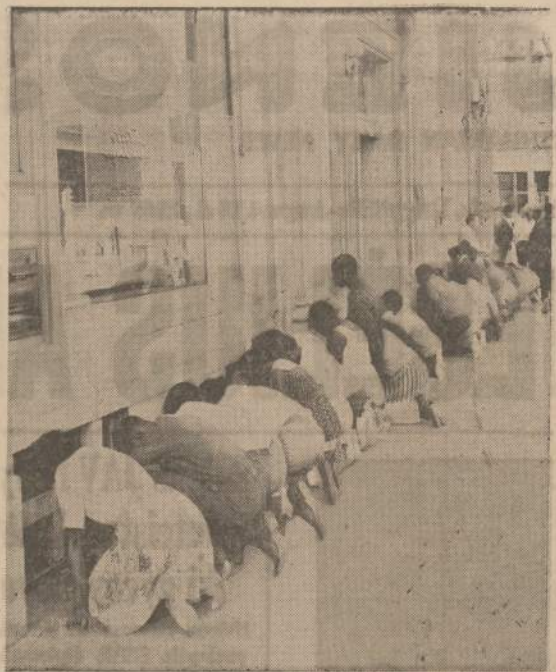
Negrai demonstruoja klūpodami ir giesmes giedodami prie Union National banko St. Louis mieste, reikalaudami darbo.

NAUJIENŲ VASARINIS PIKNIKAS Ivyks š. m. rugpiučio 18 d. BUČO PARKE Willow Springs, Ill.