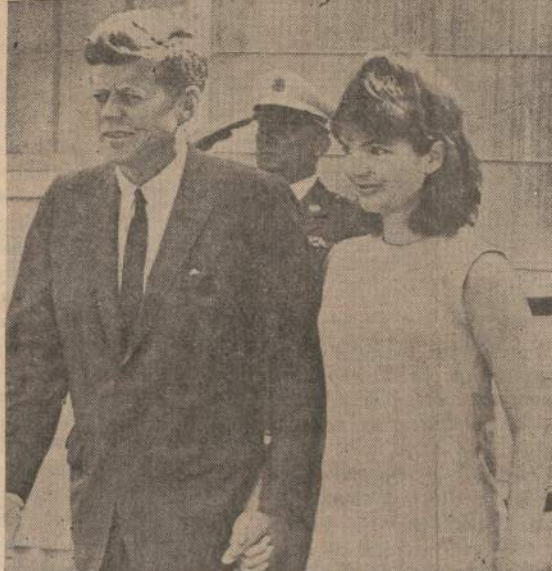
Prezidentas Kennedy išsiveda iš Otis Air Force bazės ligoninės savo žmoną, kuri praėjusią savaitę čia pagimdė sūnų, bet kokiis po dvių dienų mirė.

Jeį prez. Youlou nebūtų atsistatydinęs, būtų įvykęs didelis kraujo praliejimas.